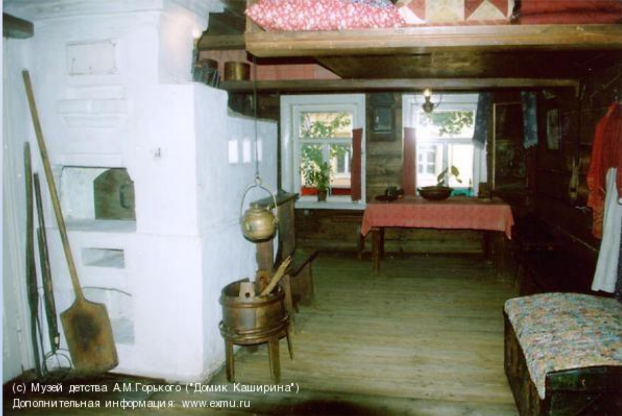
Дополнительная информация: www.exmu.ru

Музей детства М.Горького. «Домик Каширина».