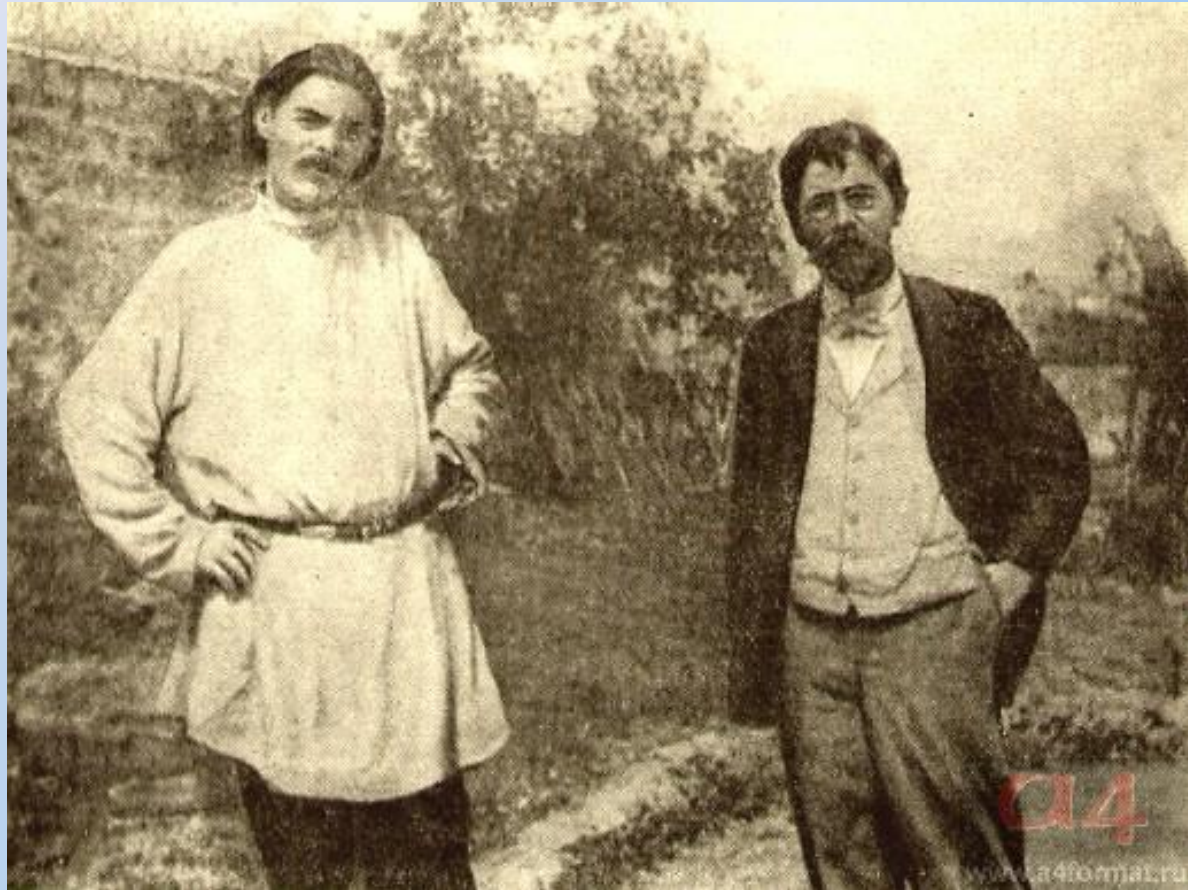
А. П. Чехов и М. Горький в саду на даче Чехова в Ялте.