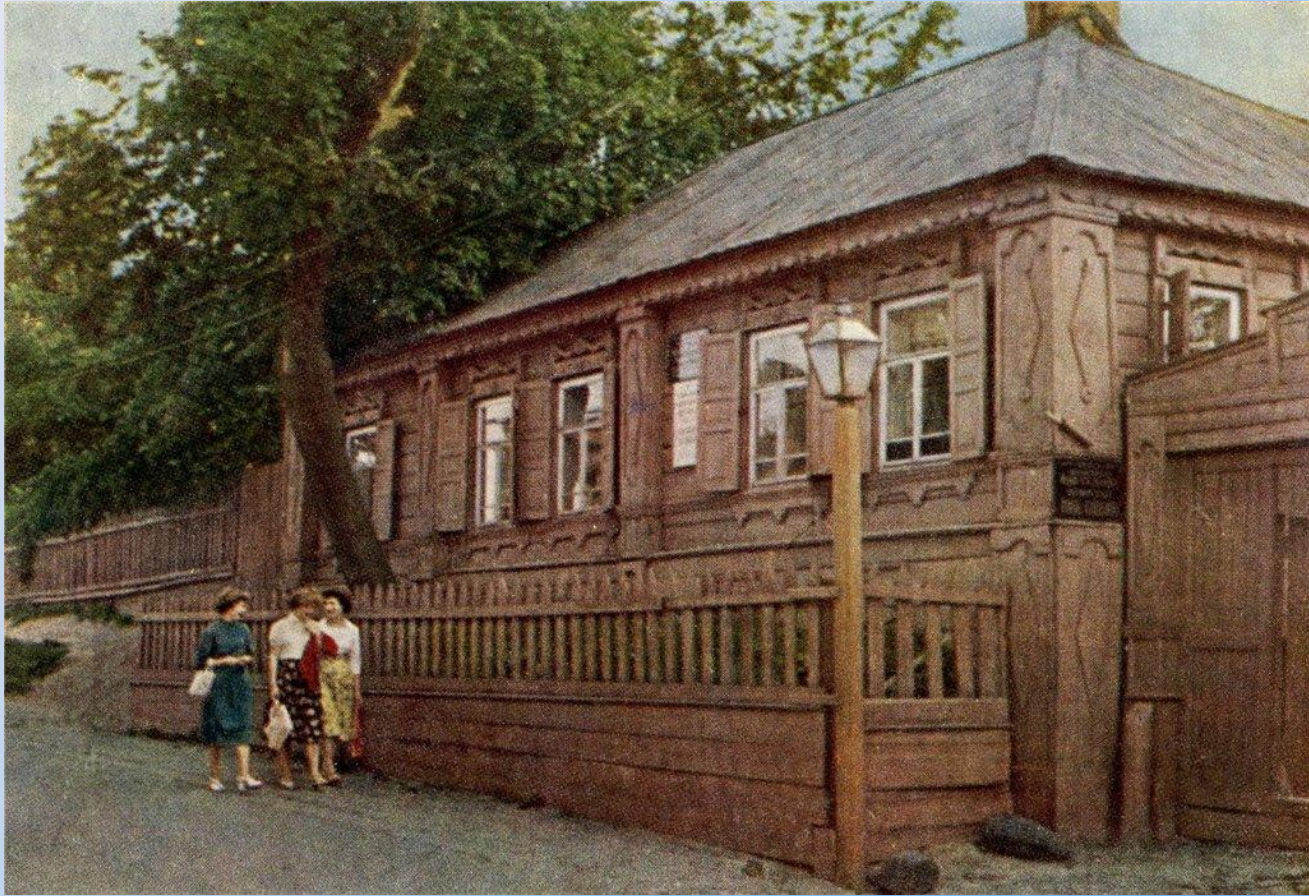
Домик Каширина, где провел детство А. М. Горький.