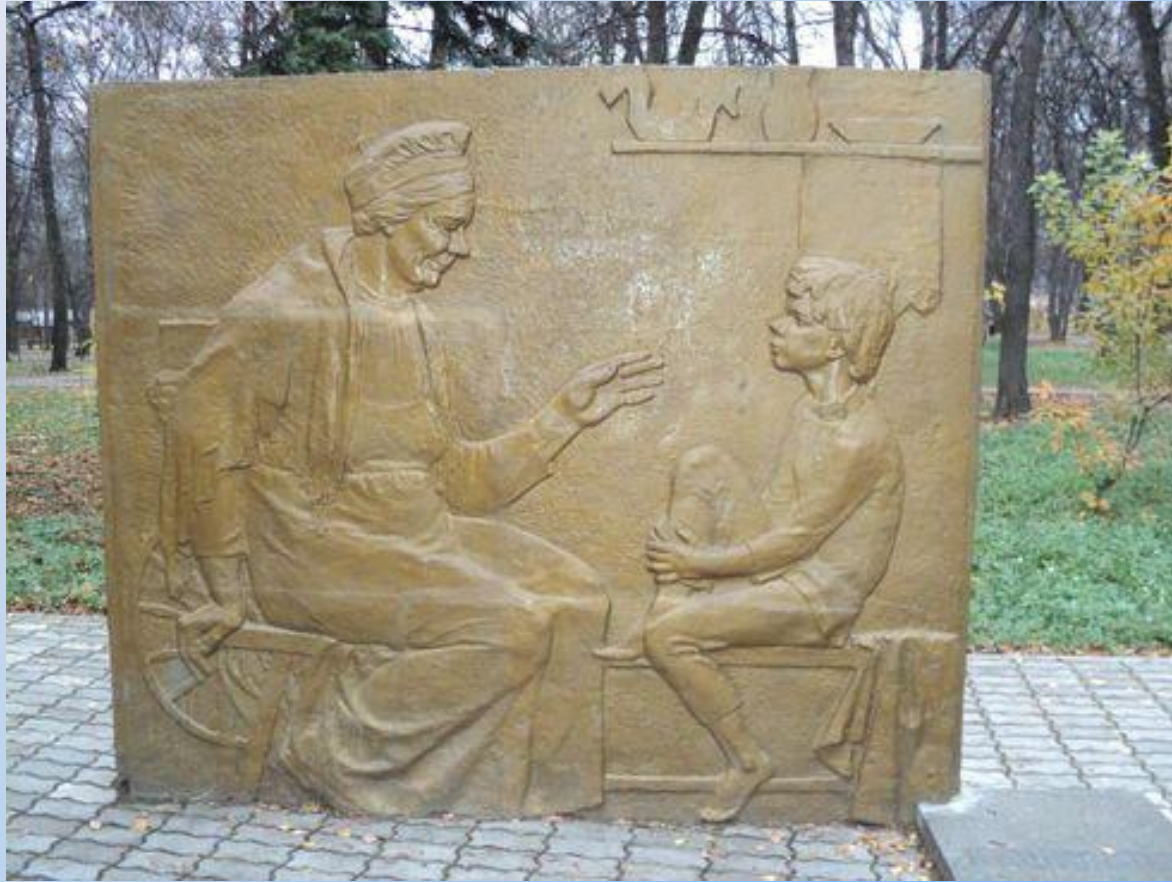
Памятник Кашириной Акулине Ивановне в Нижнем Новгороде.