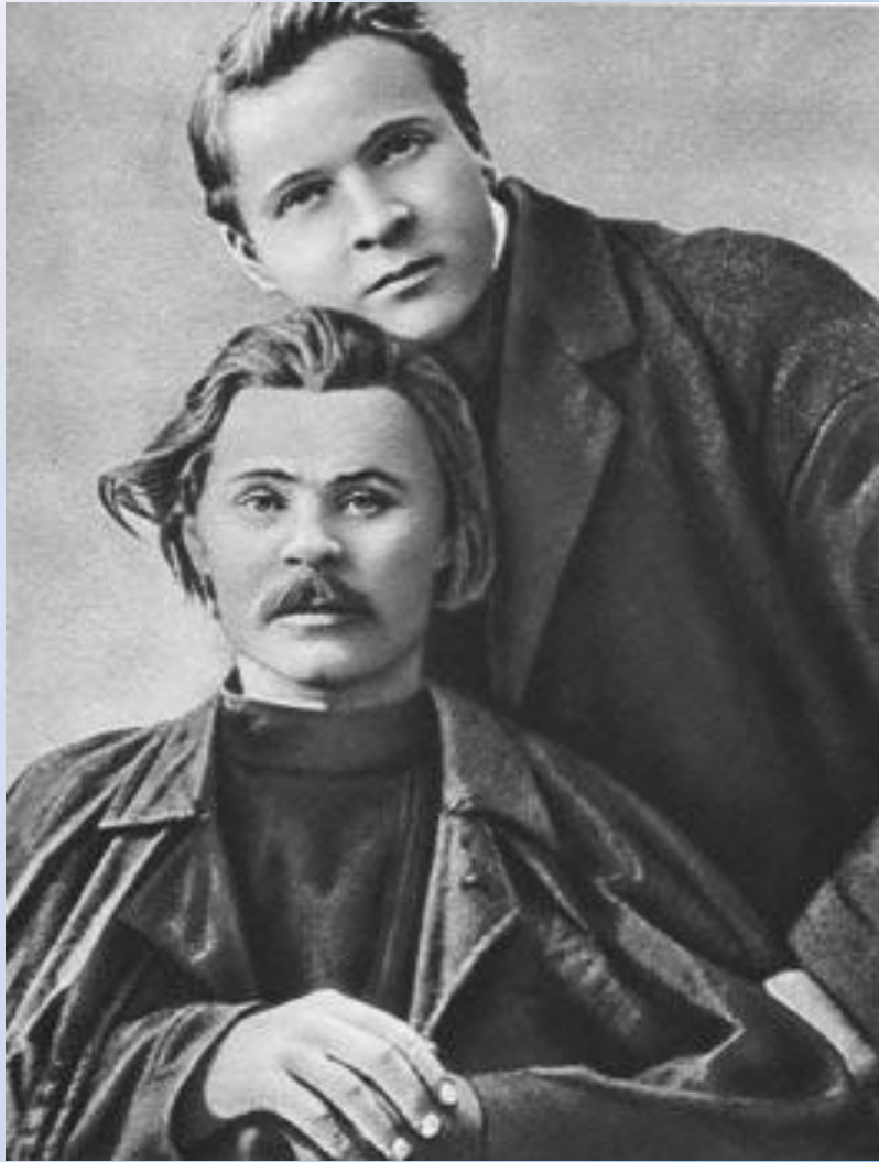
Алексей Максимович Горький и Фёдор Шаляпин, известный русский певец