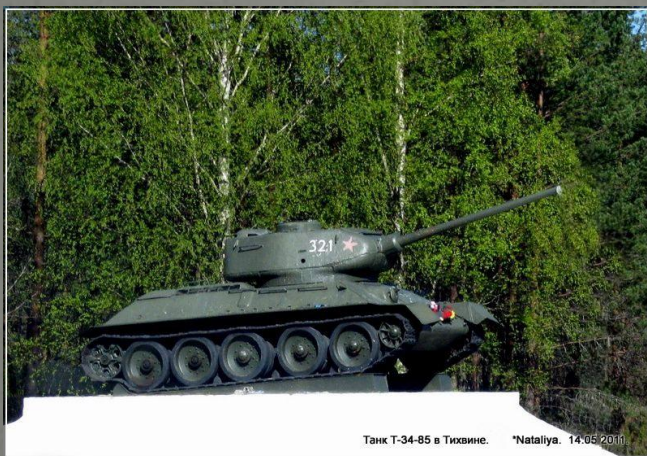
Танк Т-34-85 в Тихвине.