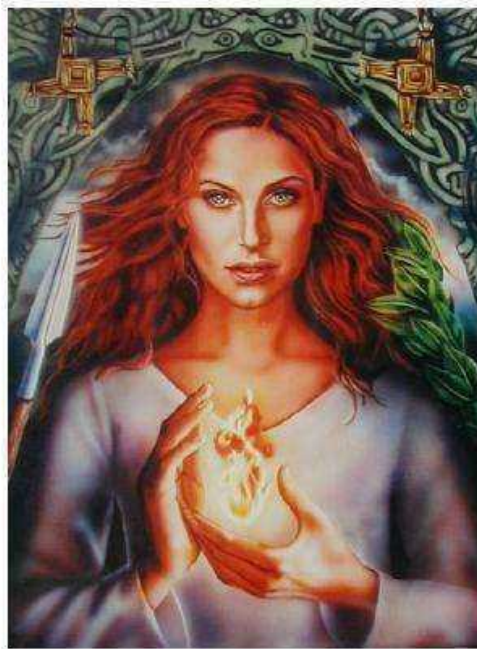
Богиня Бриджит (Кельты)