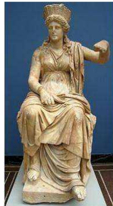
Богиня Кибела (Рим)