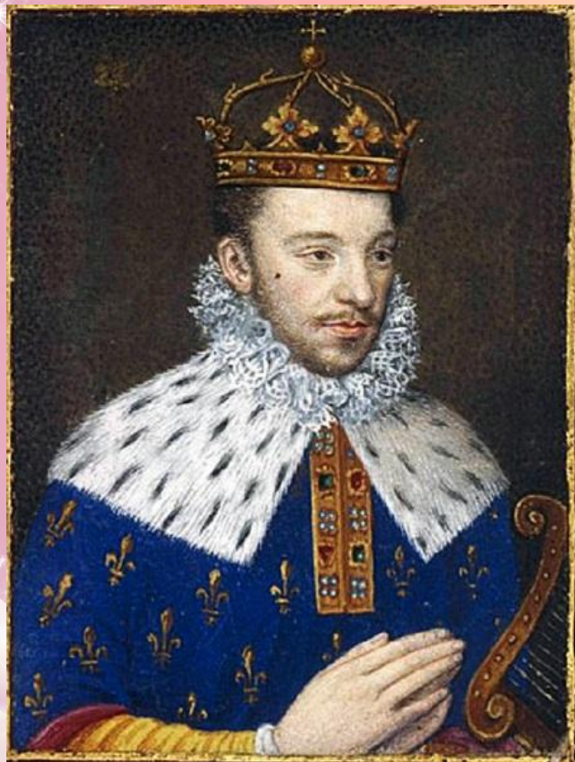
Генрих III (Англия)