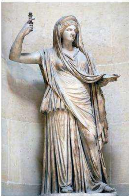
Богиня Гея (Греция)