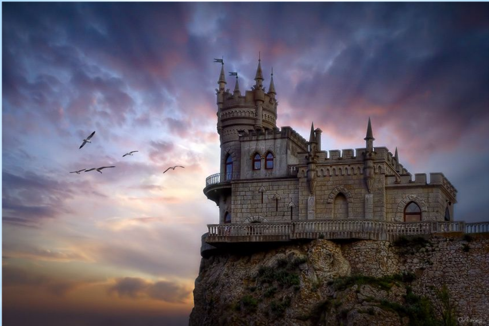
Крым. Ласточкино гнездо.