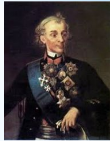
А. В. Суворов

8 апреля 1783 года Екатерина II издала манифест о принятии "полуострова Крымского", а также Кубанской стороны в состав России.