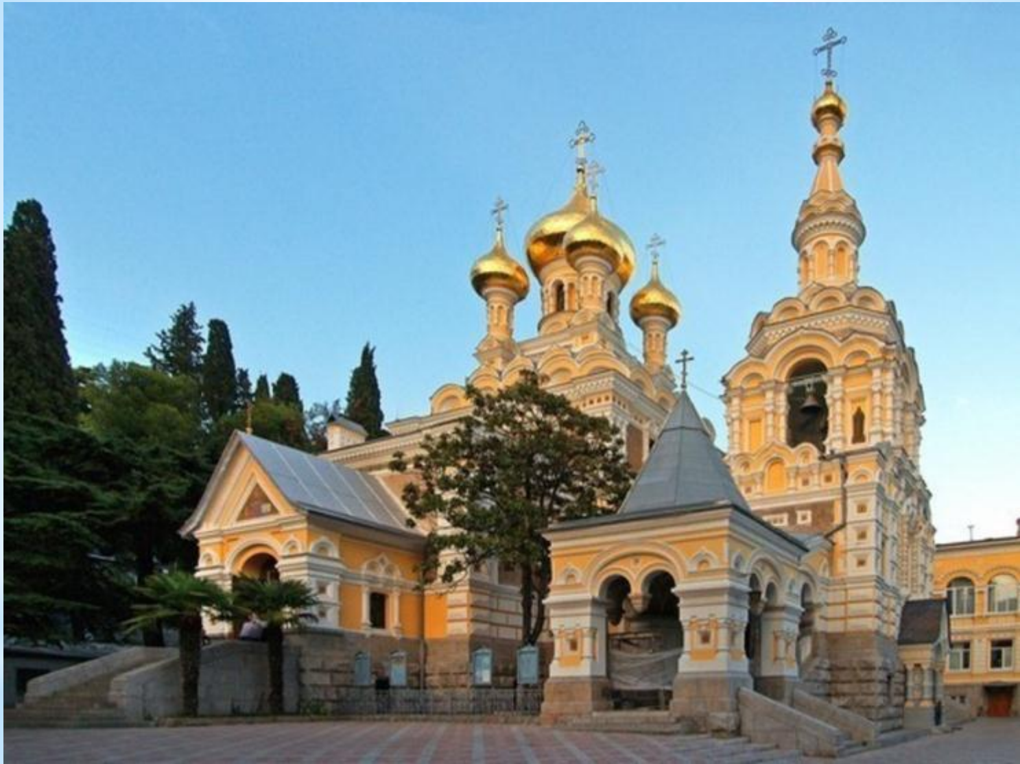
Собор Святого Александра Невского