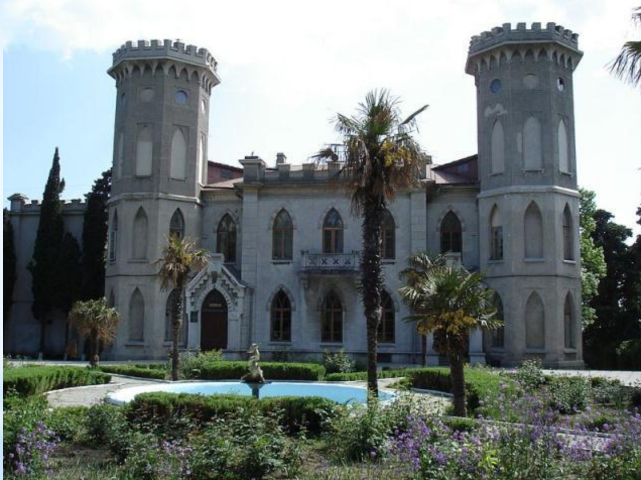
Дворец графини Паниной 19 века