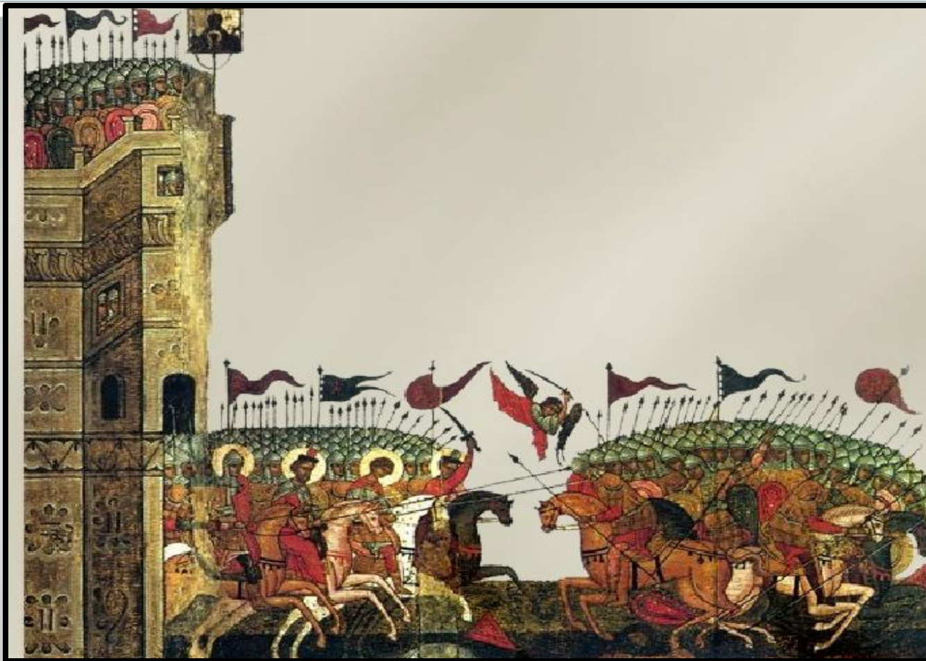
Фрагмент иконы «Битва новгородцев с Суздальцами»