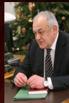
Таймура́з Дзамбе́кович Ма́мсуров