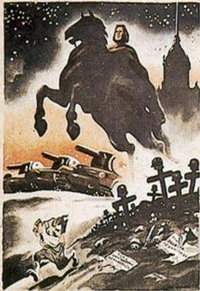
Иллюстрация: А. С. Савицкий. Рисунки: А. С. Савицкий.