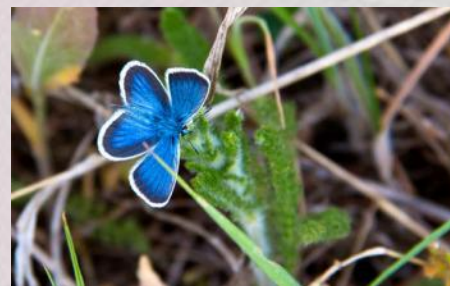
Самая маленькая бабочка Голубянка 2 см