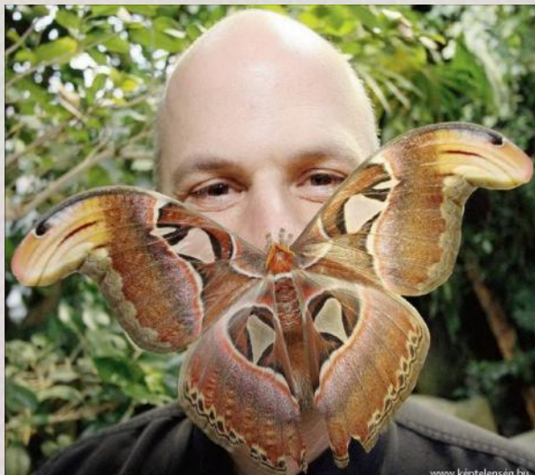
Самая большая бабочка Павлиноглазка геркулес 30 см