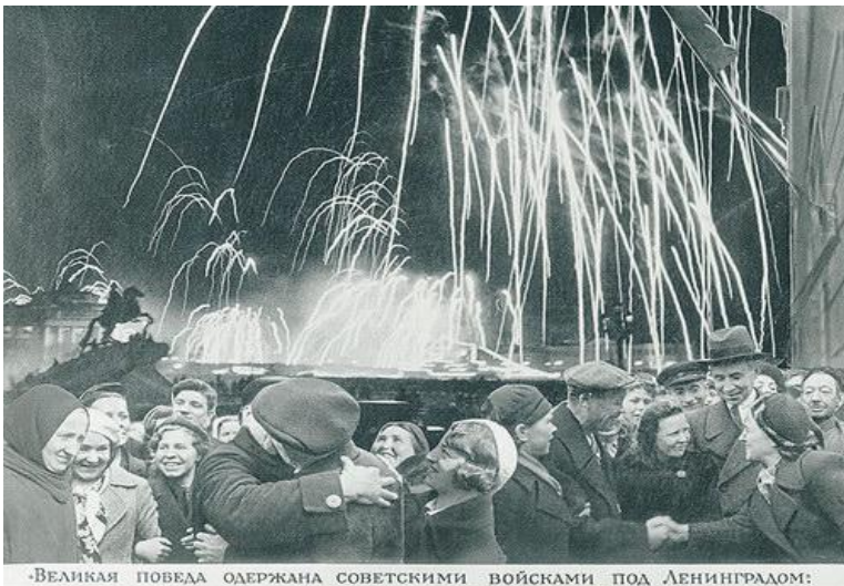
-Великая победа одержана советскими войсками под Ленинградом:

Памятник-ансамбль «Разорванное кольцо» Здесь начиналась «Дорога жизни»