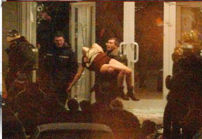
Как штурмовали Дворец культуры ГПЗ-1