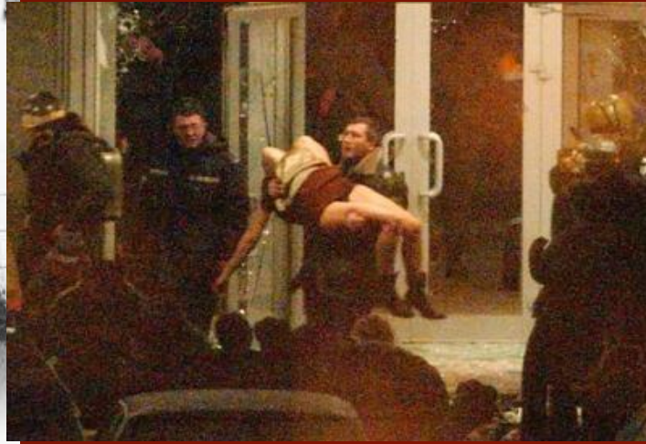
Как штурмовали Дворец культуры ГПЗ-1