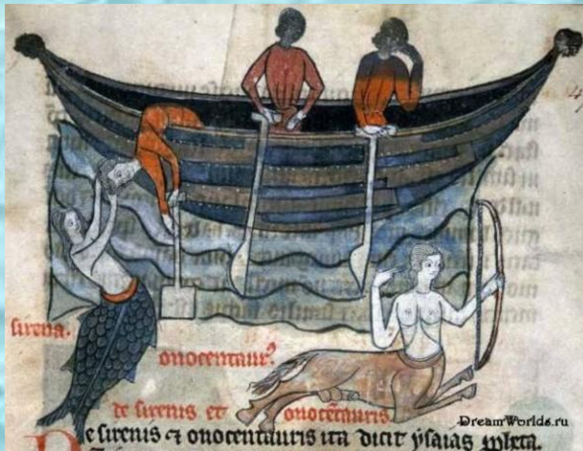
Русалки, увлекающие моряка в воду.

С другой стороны, даже первые моряки верили в «злую» силу моря, в котором водится различная нечистая сила. И полоски на рубашке служили оберегом от всякого морского зла.