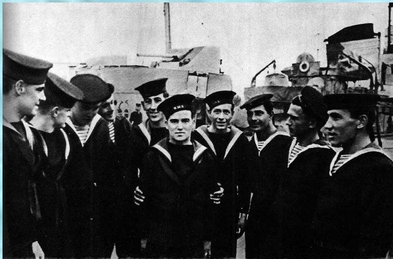
Английские моряки. Начало XX века

Рассматривая форму матросов разных флотов, замечаешь, что все они имеют одну общую деталь – полосатую тельняшку. Как она появилась на флоте и почему полосатая?