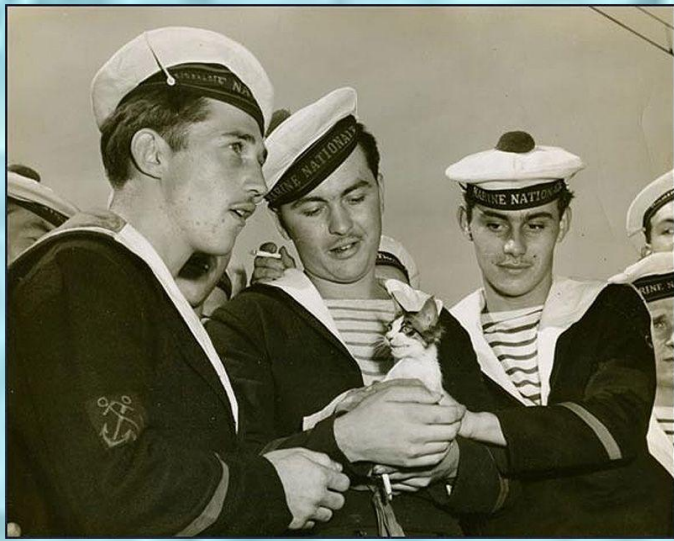
Французские моряки. Начало XX века