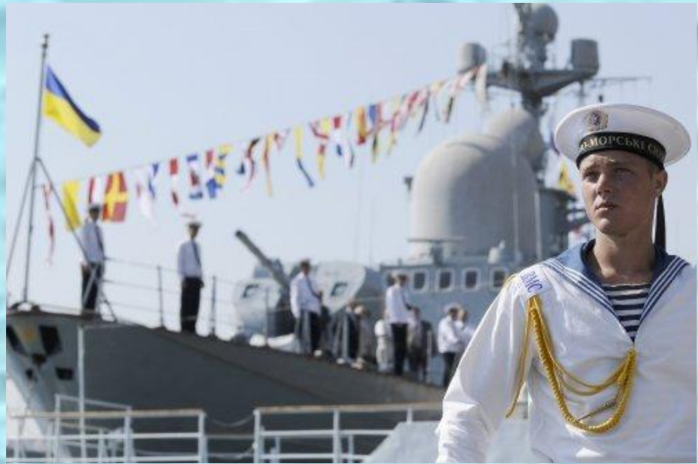
Российские моряки. Начало XXI века