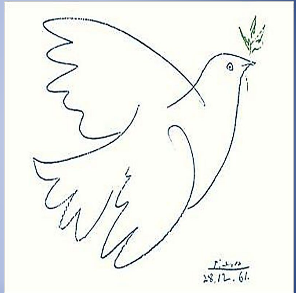
Рисунок 1961 года