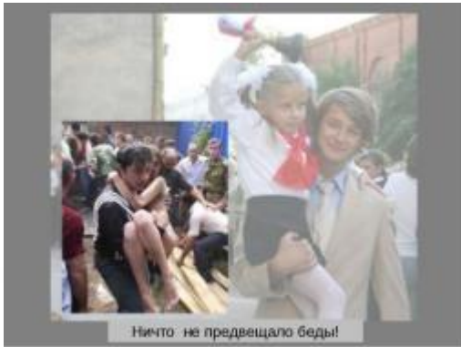
Ничто - не предвещало беды!