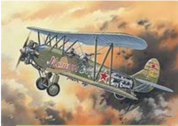
Мстим за боевых друзей