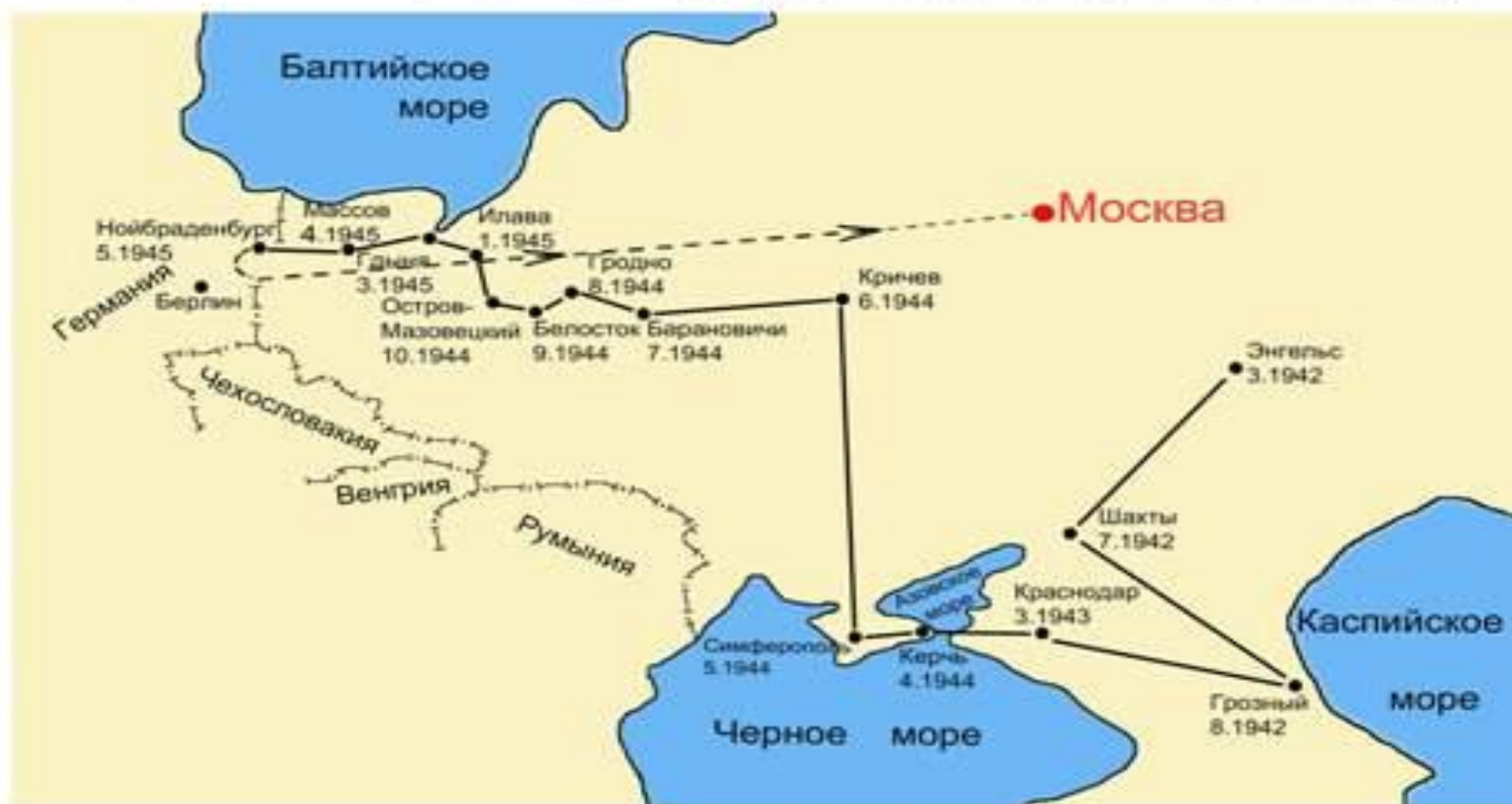
СХЕМА БОЕВОГО ПУТИ ПОЛКА