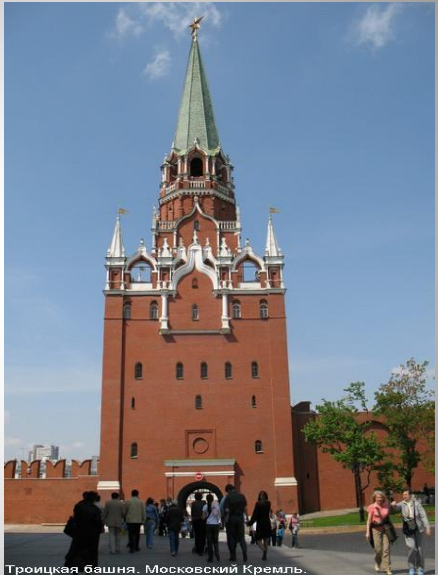
Троицкая башня. Московский Кремль.

Самая красивая, нарядная, стройная, а самое главное, самая высокая - высота моя 80 м. Имела два тайника. Колодец и выход К реке.