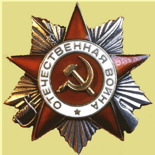
Прадедущка Федосеева Саши