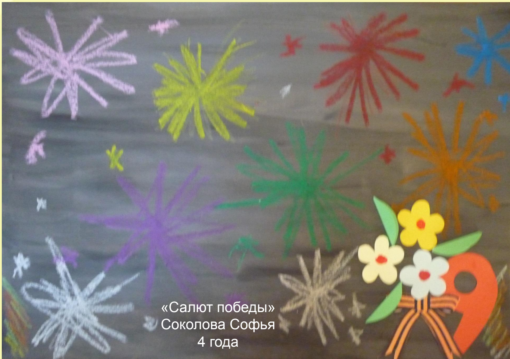
«Салют победы» Соколова Софья 4 года