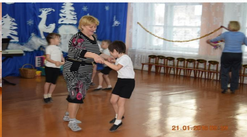
«Танцы со сменой партнера»