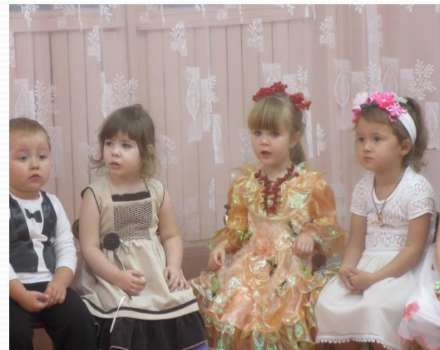
«Игры на внимание»