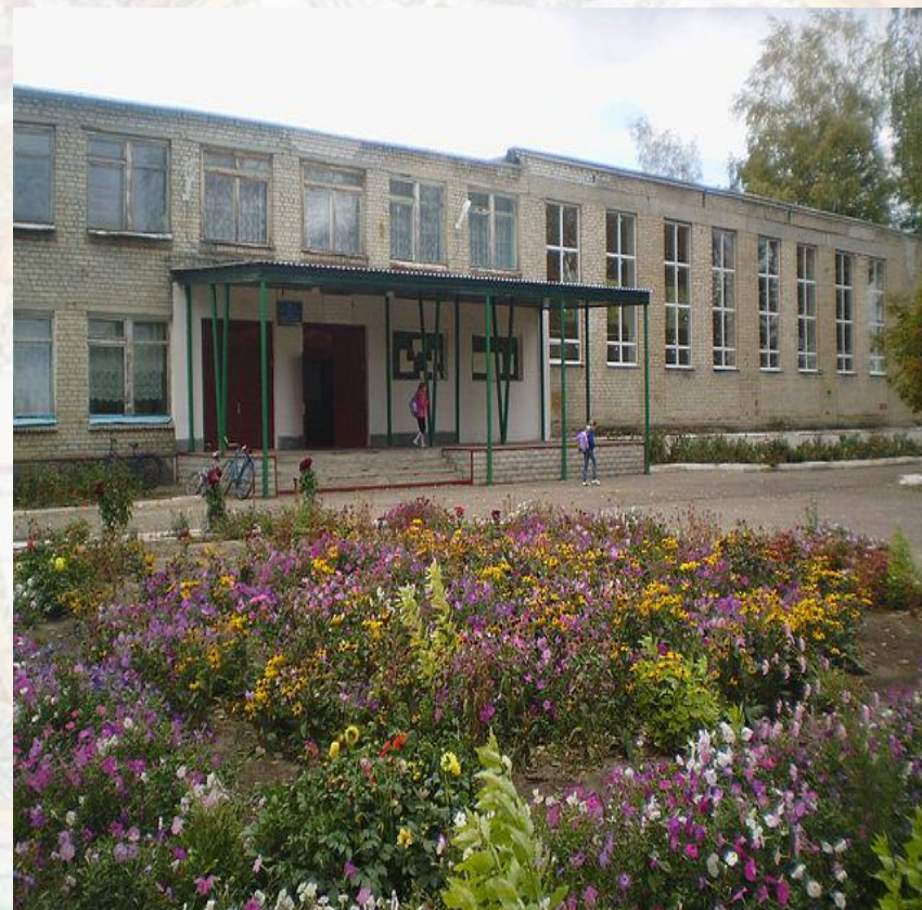
МБОУ «СОШ № 1 р.п. Самойловка»

«Если мы будем учить сегодня так, как учили вчера – мы украдем у наших детей завтра» (Дж. Дьюи)