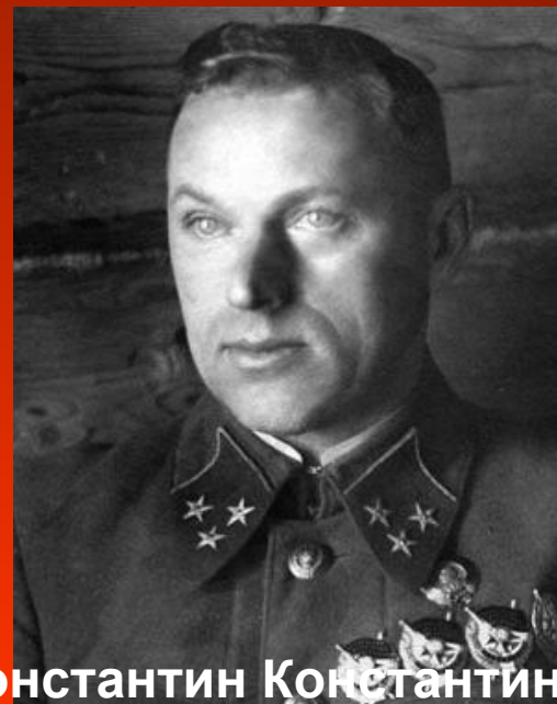
Константин Константинович Рокоссовский