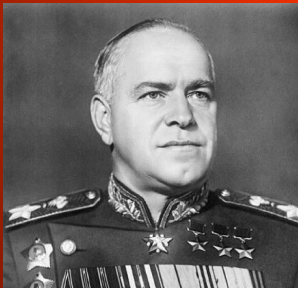
Георгий Константинович Жуков