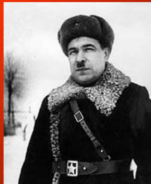
Леонид Александрович Говоров