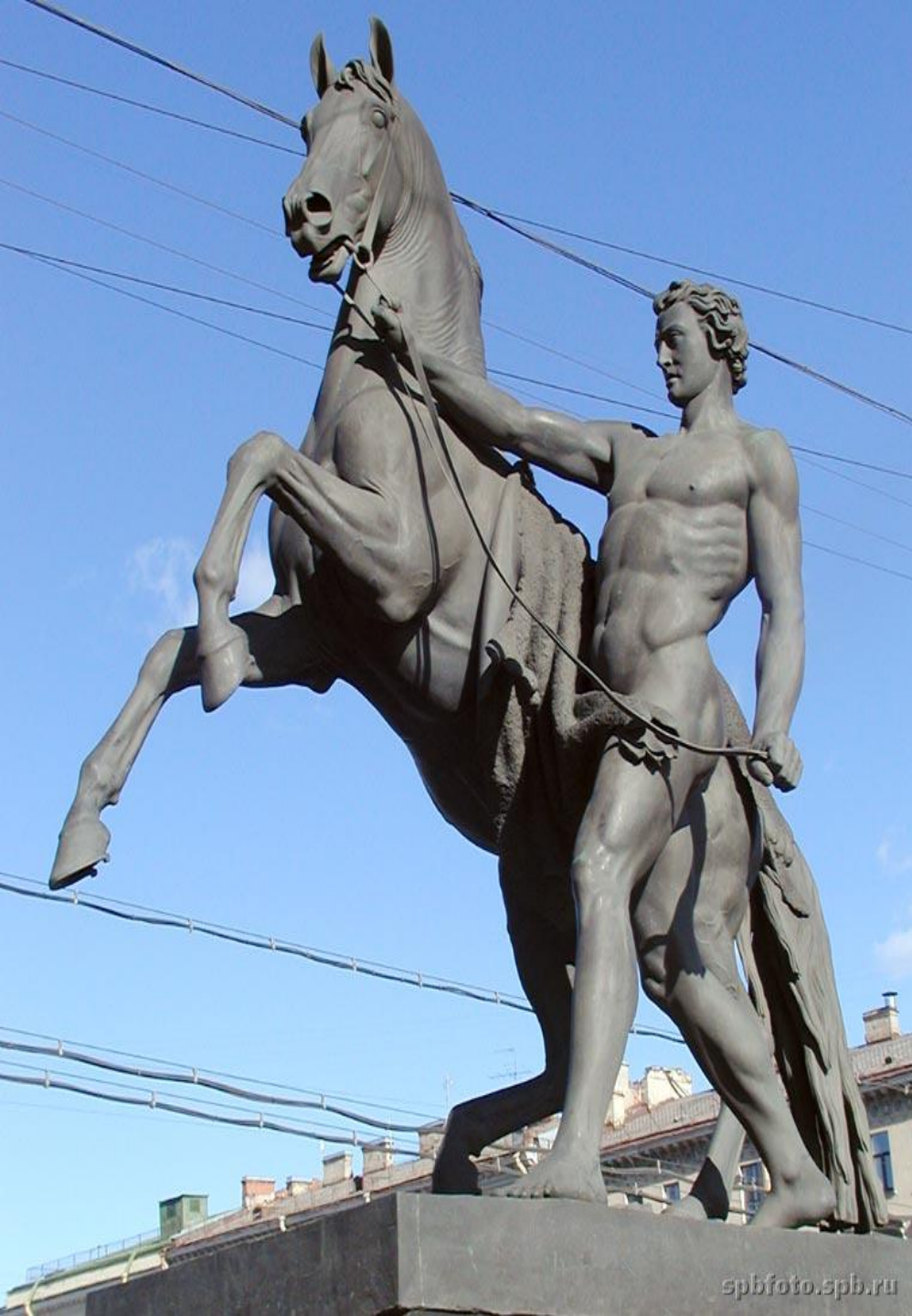
АНИЧКОВ МОСТ Скульптор П.К. Клодт. 1841-1850