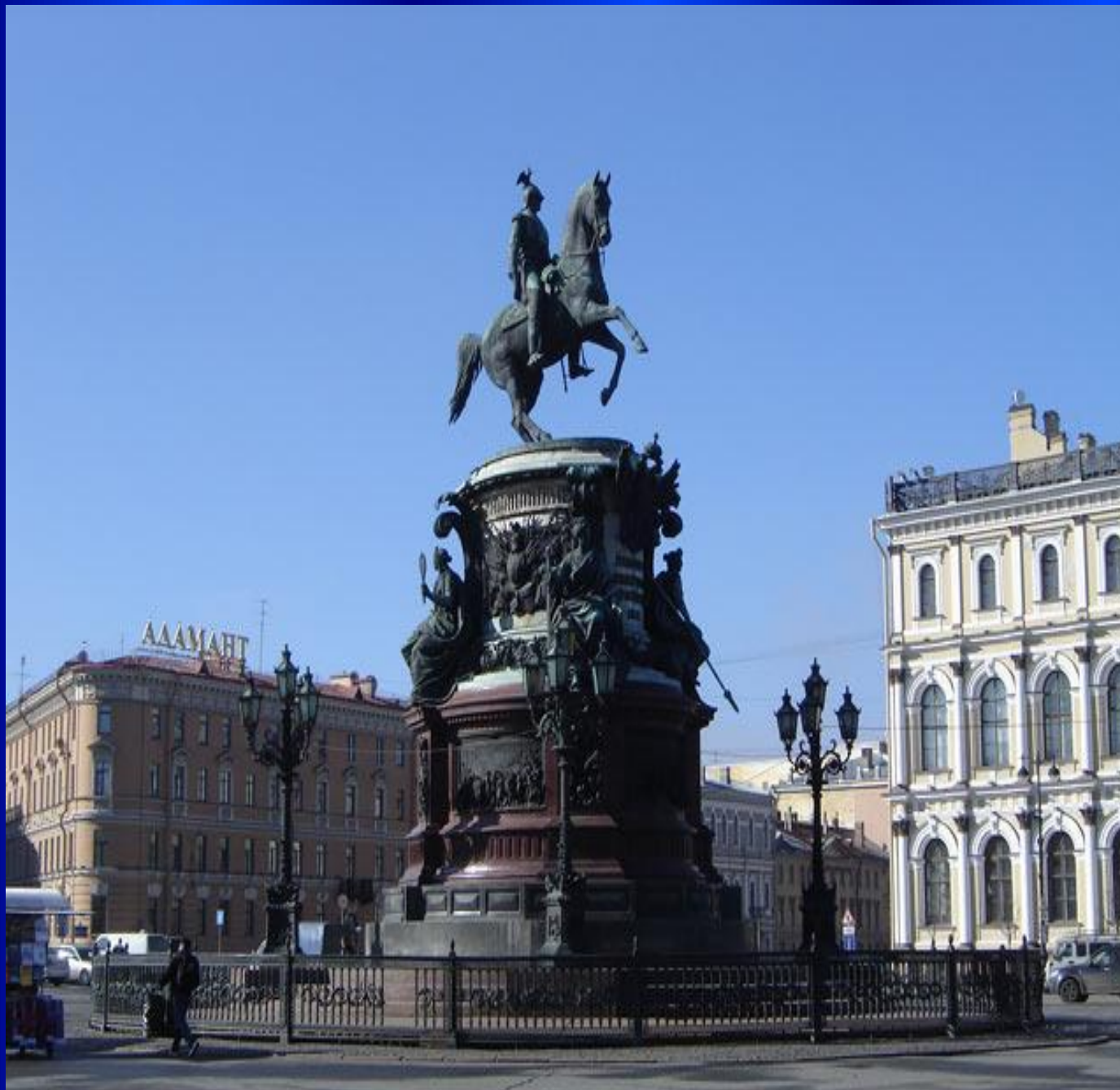
Памятник Николаю I на Исаакиевско й площади