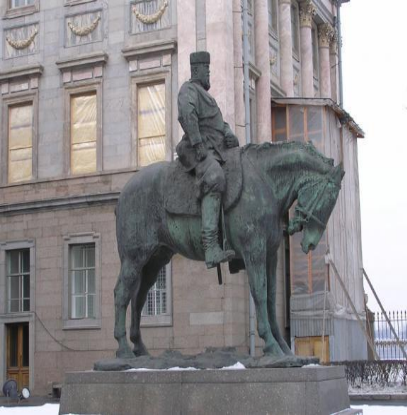
Памятник Александру 3 во дворе Мраморного дворца