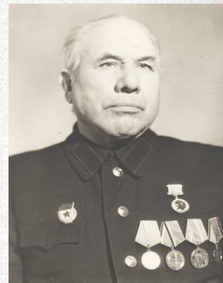
Фомин Василий Захарович