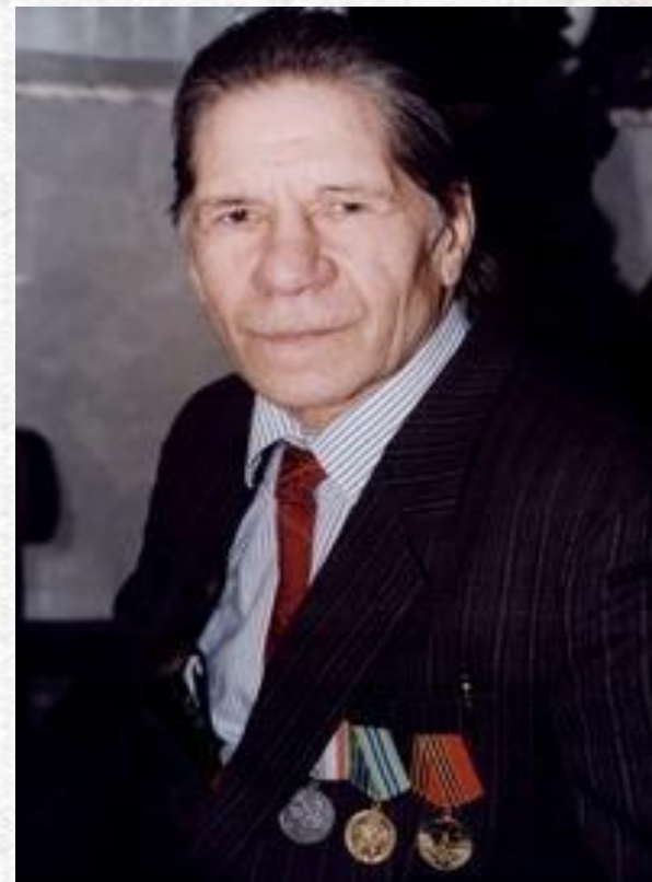
Информация из книги «Сельское поселение Угут». Фотография из книги «Подвижники из Угута».