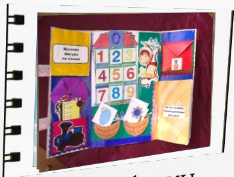
Новые формы работы