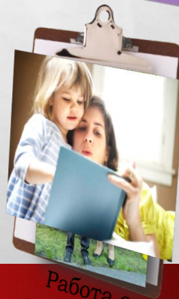
Работа с родителями