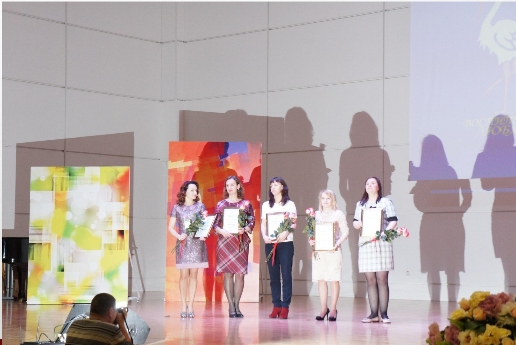
ФИНАЛИСТЫ ОБЛАСТНОГО КОНКУРСА «ВОСПИТАТЕЛЬ ГОДА - 2016»