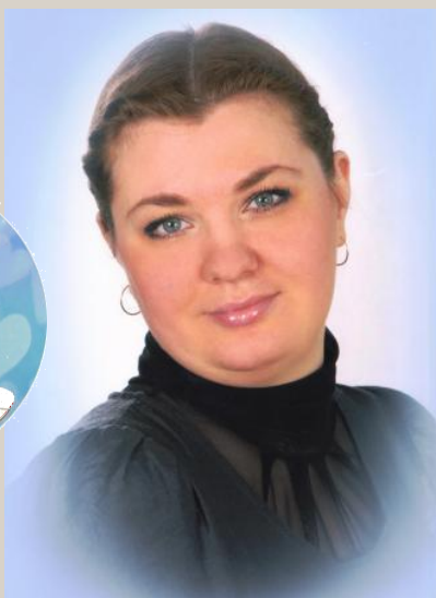
Педагог – исследователь