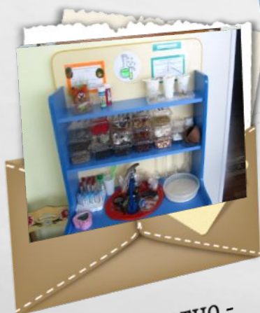
Предметно - развивающая среда