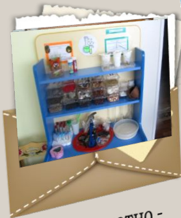
Предметно - развивающая среда