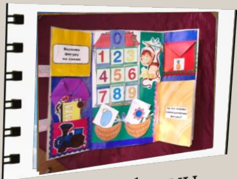
Новые формы работы