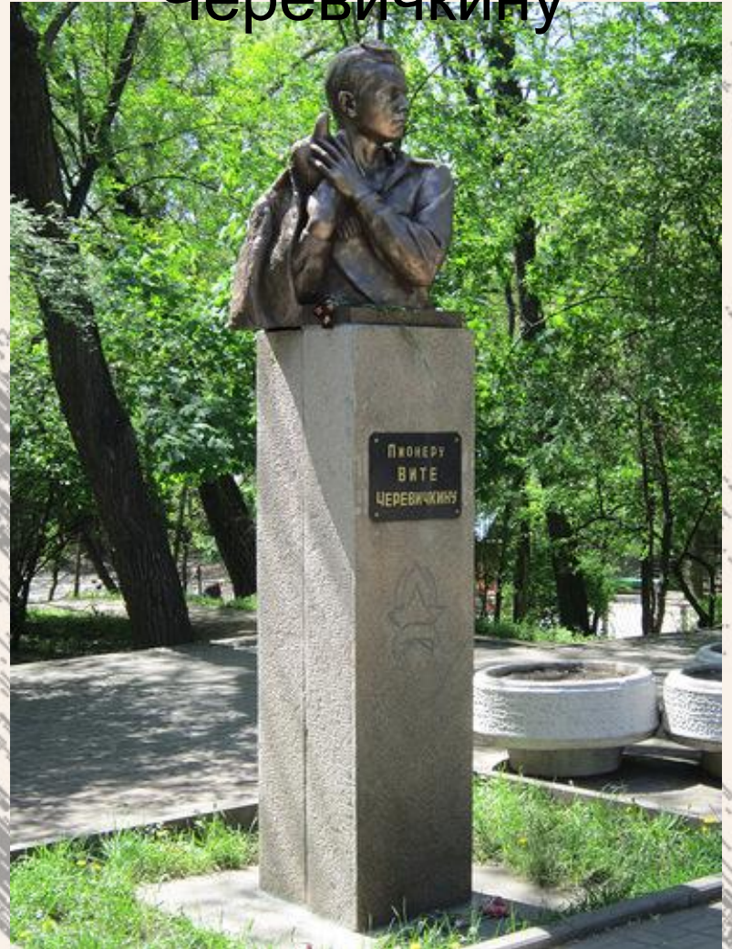
Памятник Вите Черевичкину