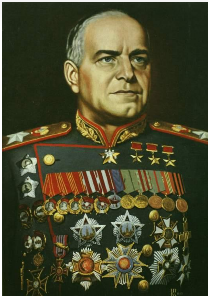
Жуков Константин Георгиевич ( 1896 – 1947)