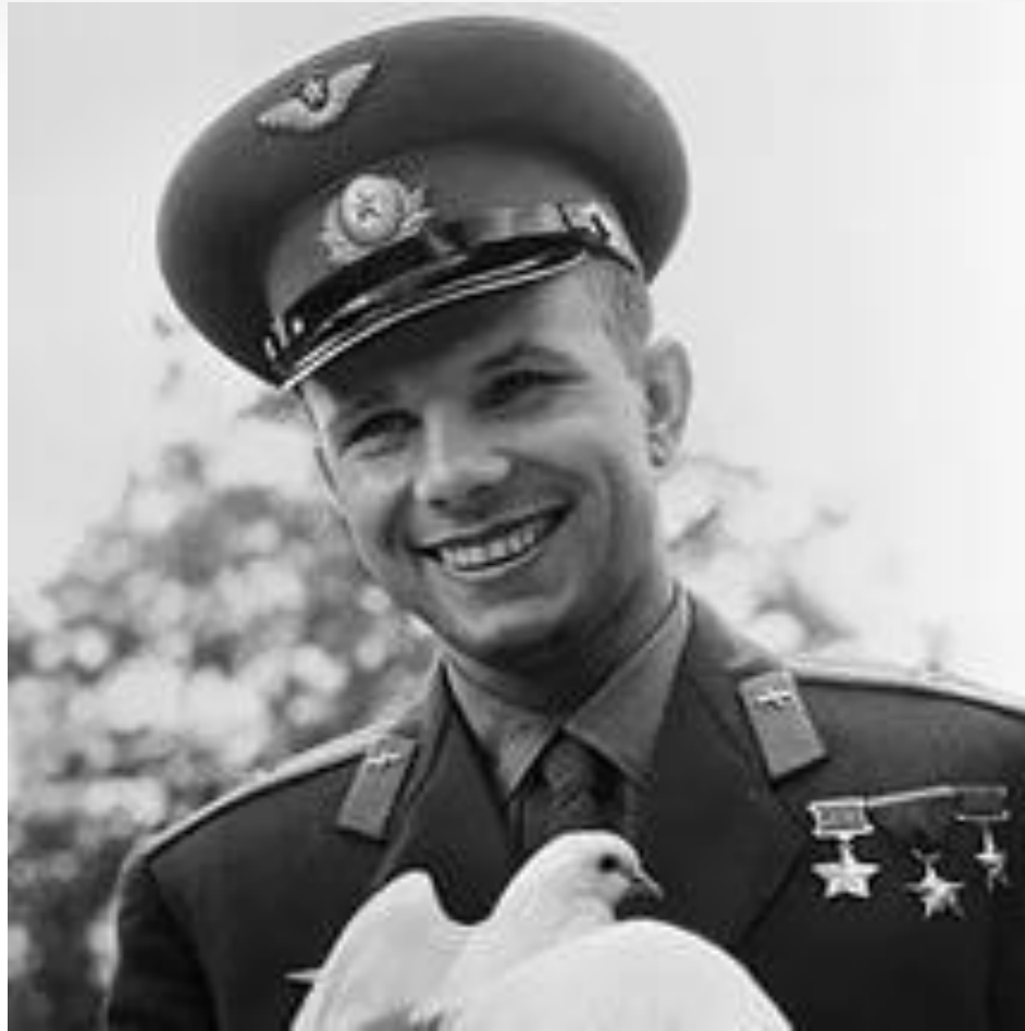
Юрий Алексеевич Гагарин (1934 – 1968)