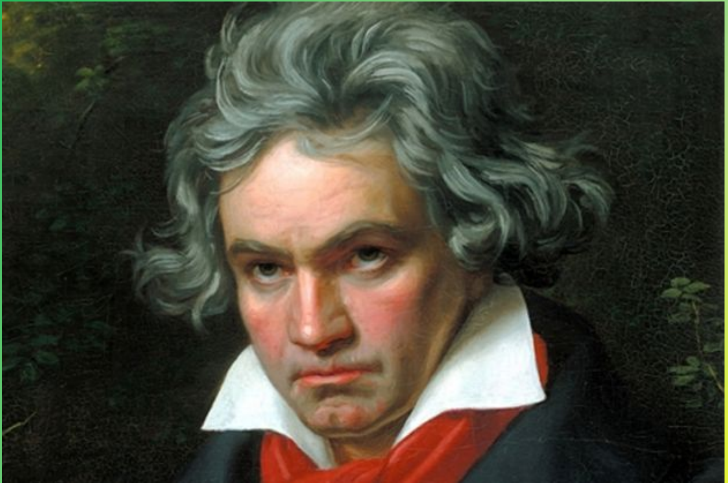
Людвиг Ван Бетховен (1770-1827)