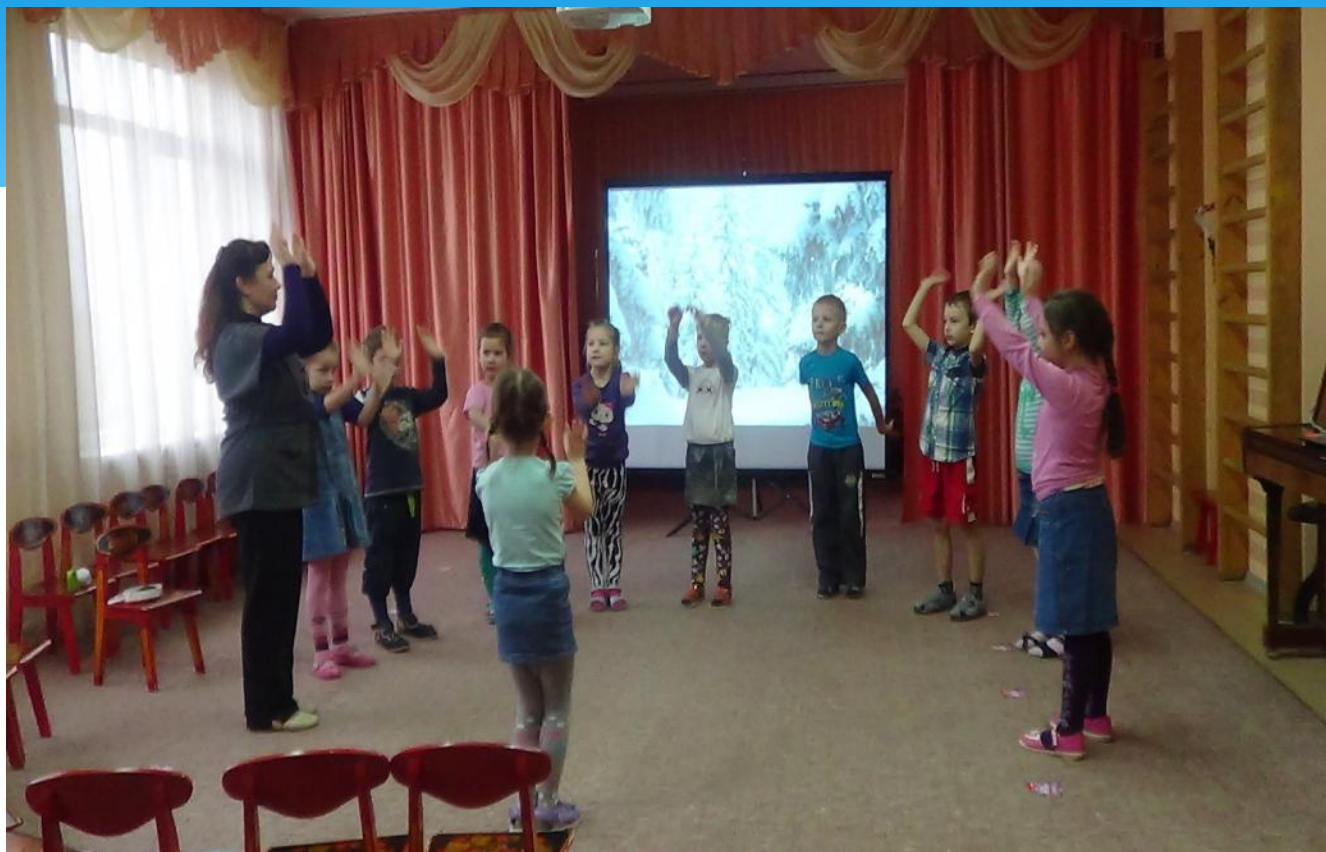
8. Возвращение в детский сад. Подведение итогов занятия.