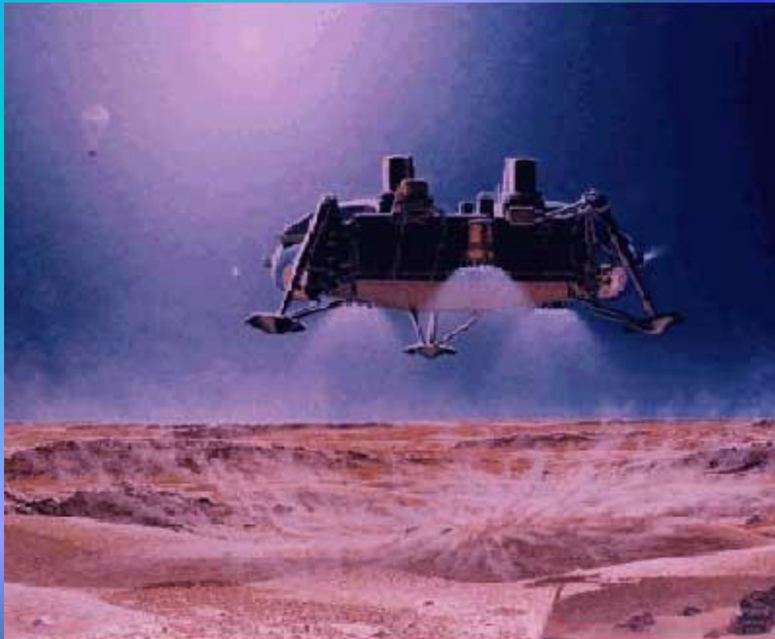
Третья космическая остановка «Луна»