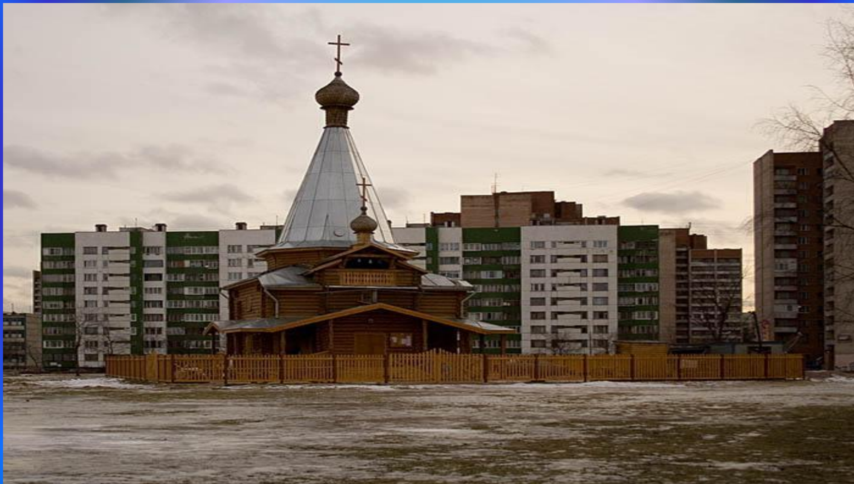
ЦЕРКОВЬ АНТОНИЯ СИЙСКОГО.