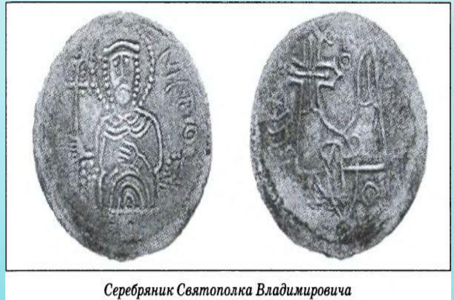
Серебряник Святополка Владимировича