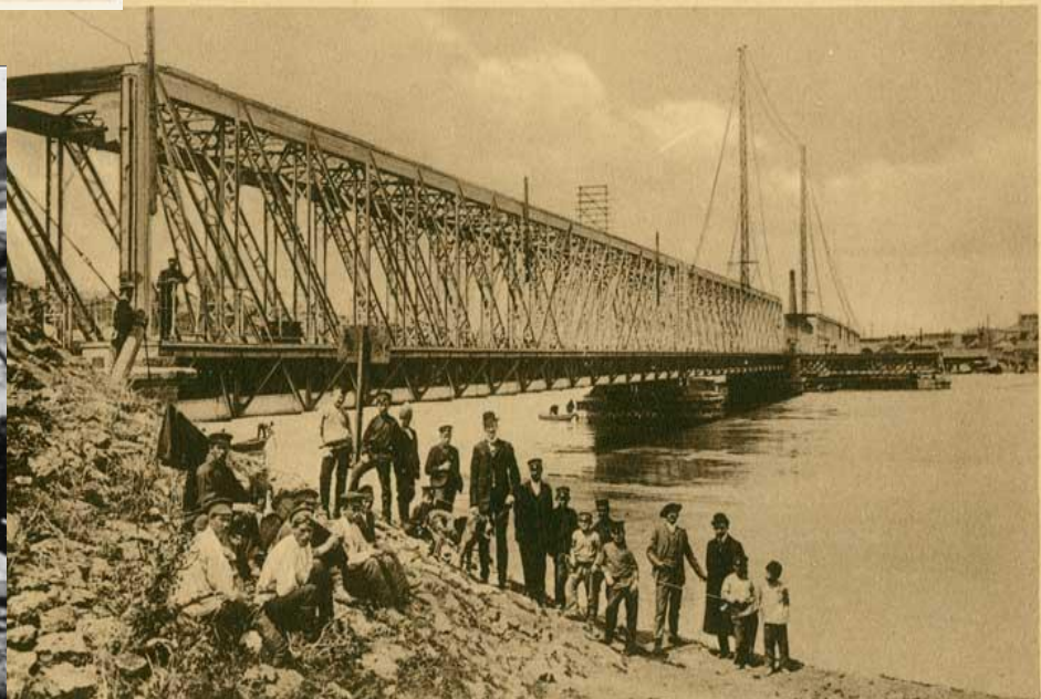
Ростов н. Д.