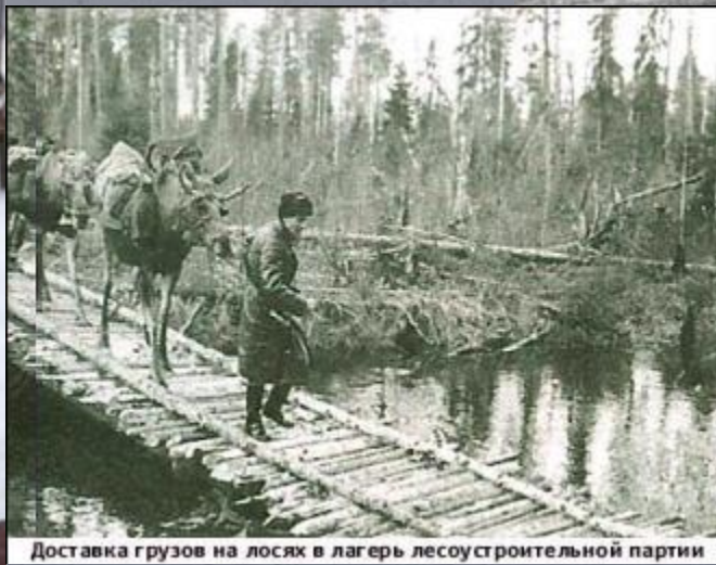
Доставка грузов на лосях в лагерь лесостроительной партии