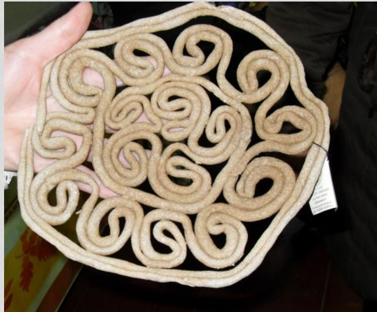
«Тетёрки» из Каргополя