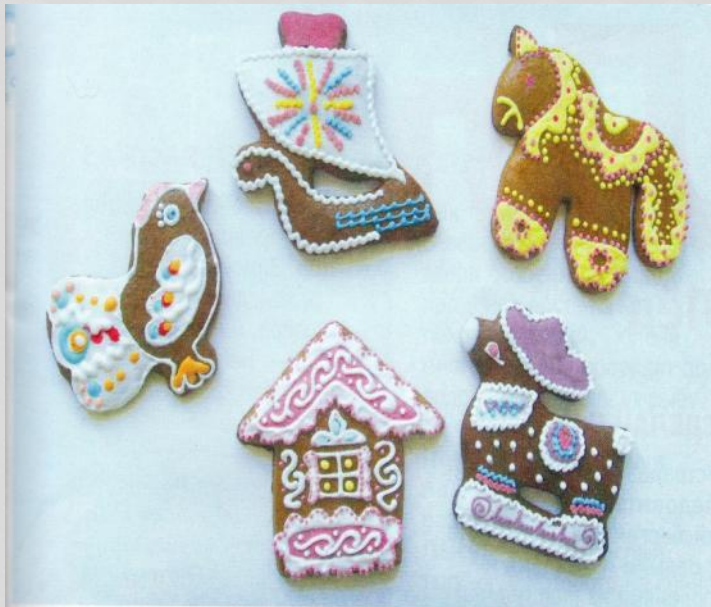
«Козули» из Архангельска