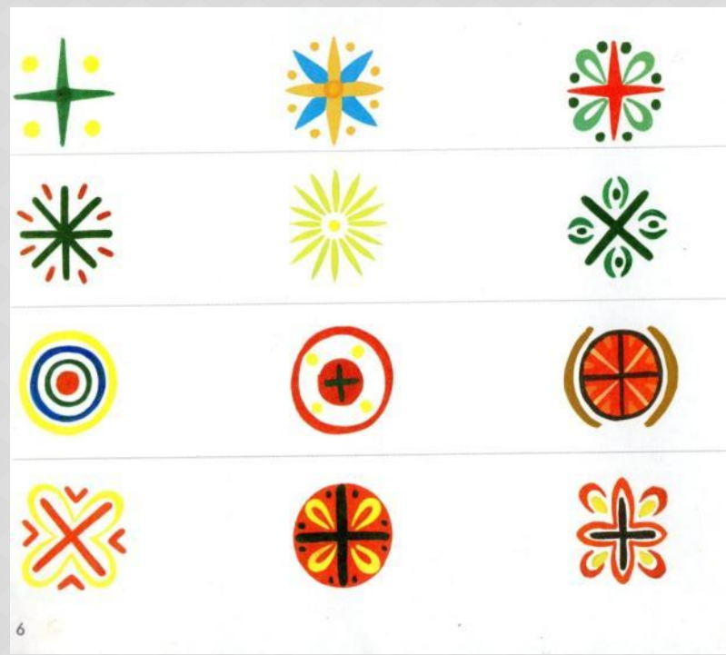
Узоры и орнаменты