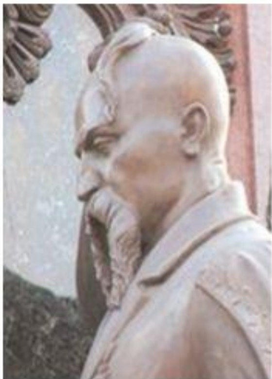
Сидор (Савва) Белый 1730-е — 1788