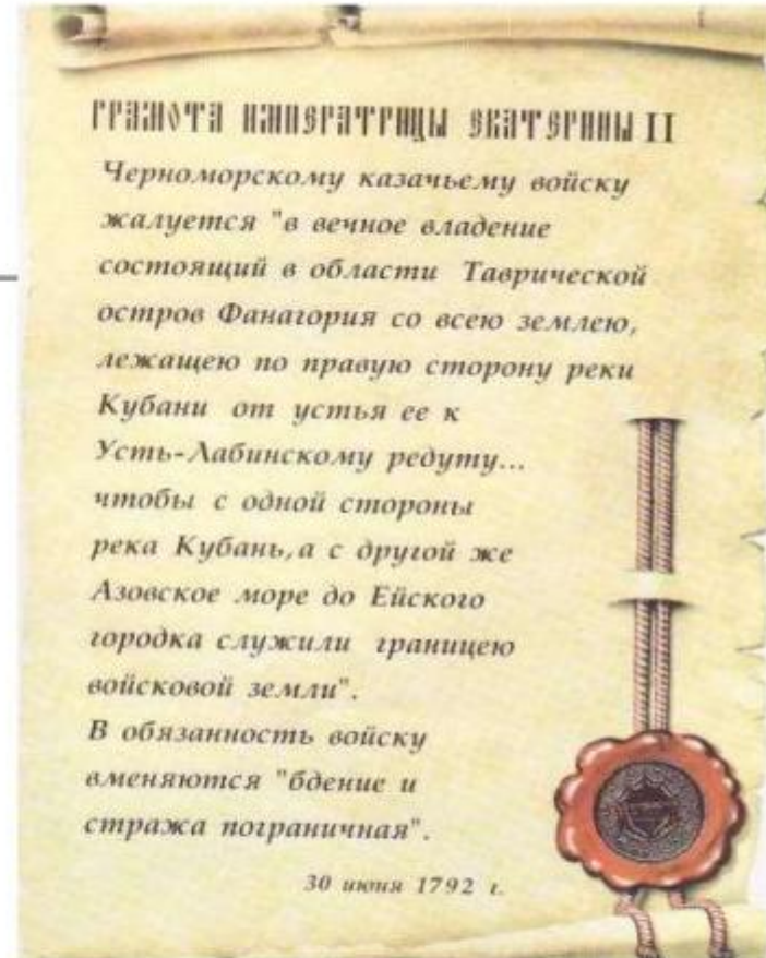
Главная реликвия Кубанского казачьего войска - жалованная грамота императрицы Екатерины II, дарованная казакам в июне 1792 год