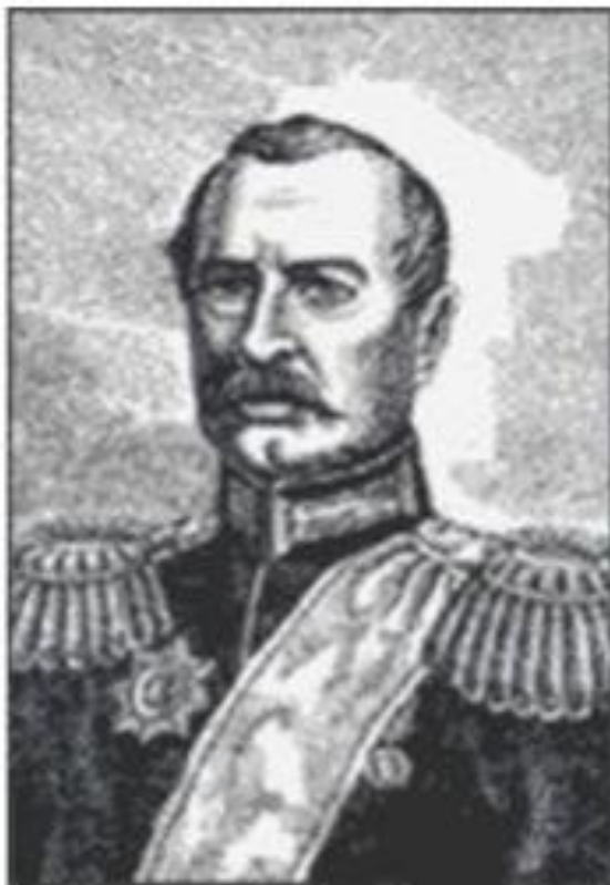
Антон Головатый 1732 — 1797