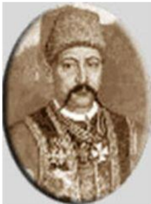
Захарий Чепега 1726 — 1797