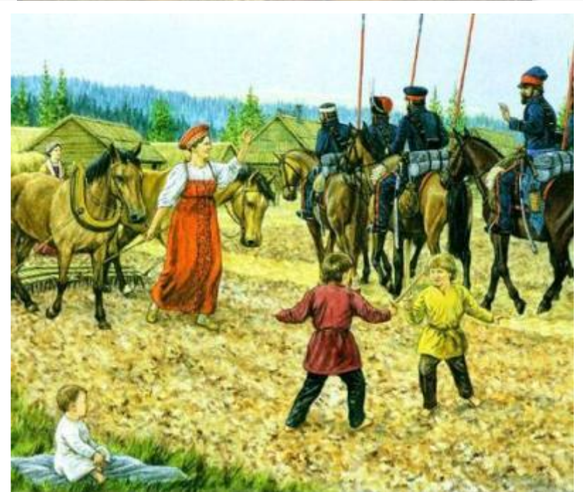
Дети с детства учились военному искусству