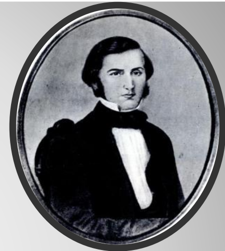
К. Д. Ушинский Мәскәү университеты студенты

Гимназияне тәмамлагач, Мәскәү университетының юридик факультетына укырга керә. Ушинский әдәбият белән нык кызыксына, театрны бик ярата һәм халыкка аң-белем тарату турында хыяллана.