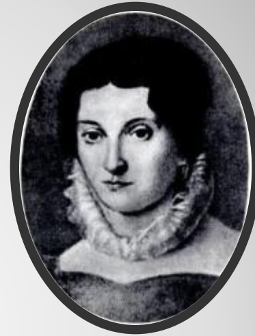
Любовь Степановна Ушинская (Капнист)

Бик күп еллар армиядә хезмәт итә, 1812 елдагы сугышның ветераны.