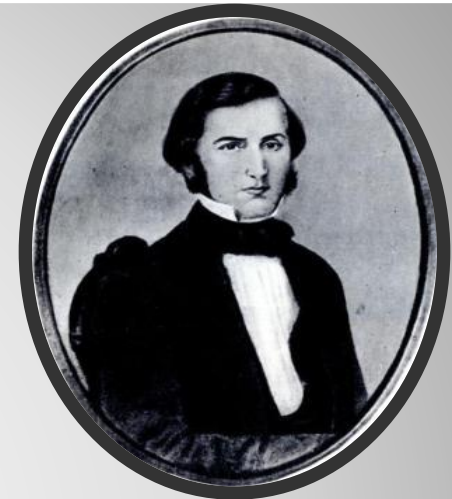
К. Д. Ушинский Мәскәү университеты студенты

Гимназияне тәмамлагач, Мәскәү университетының юридик факультетына укырга керә. Ушинский әдәбият белән нык кызыксына, театрны бик ярата һәм халыкка аң-белем тарату турында хыяллана.