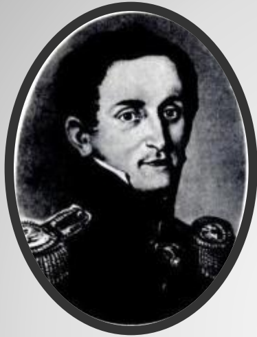
Дмитрий Григорьевич Ушинский

Бик күп еллар армиядә хезмәт итә, 1812 елдагы сугышның ветераны.