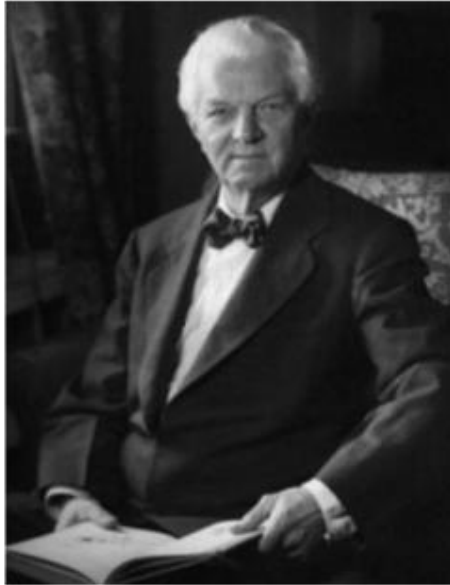
Уильям Херд Килпатрик (1871-1965)

Проект - это всякое действие, совершаемое от всего сердца и с определенной целью. Проект - это комплекс действий, специально организованный педагогами и выполняемый детьми и взрослыми участниками проекта.