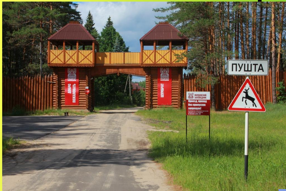
Национальный парк «Смольный» на территории Ичалковского и Большеигнатовского районов.