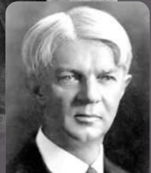
Уильям Херд Килпатрик