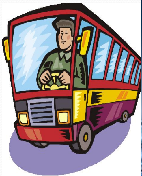
рисунок - рис