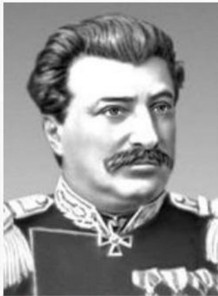
Nikolaj Michajlovič Prževal'skij