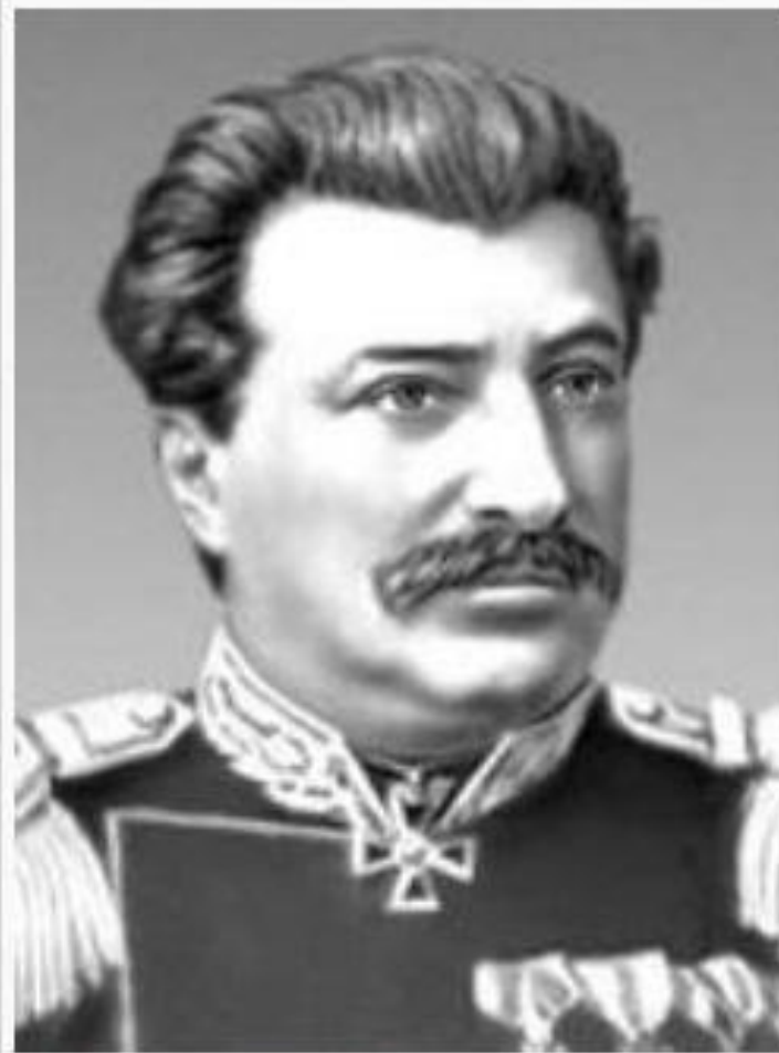
Nikolaj Michajlovič Prževal'skij