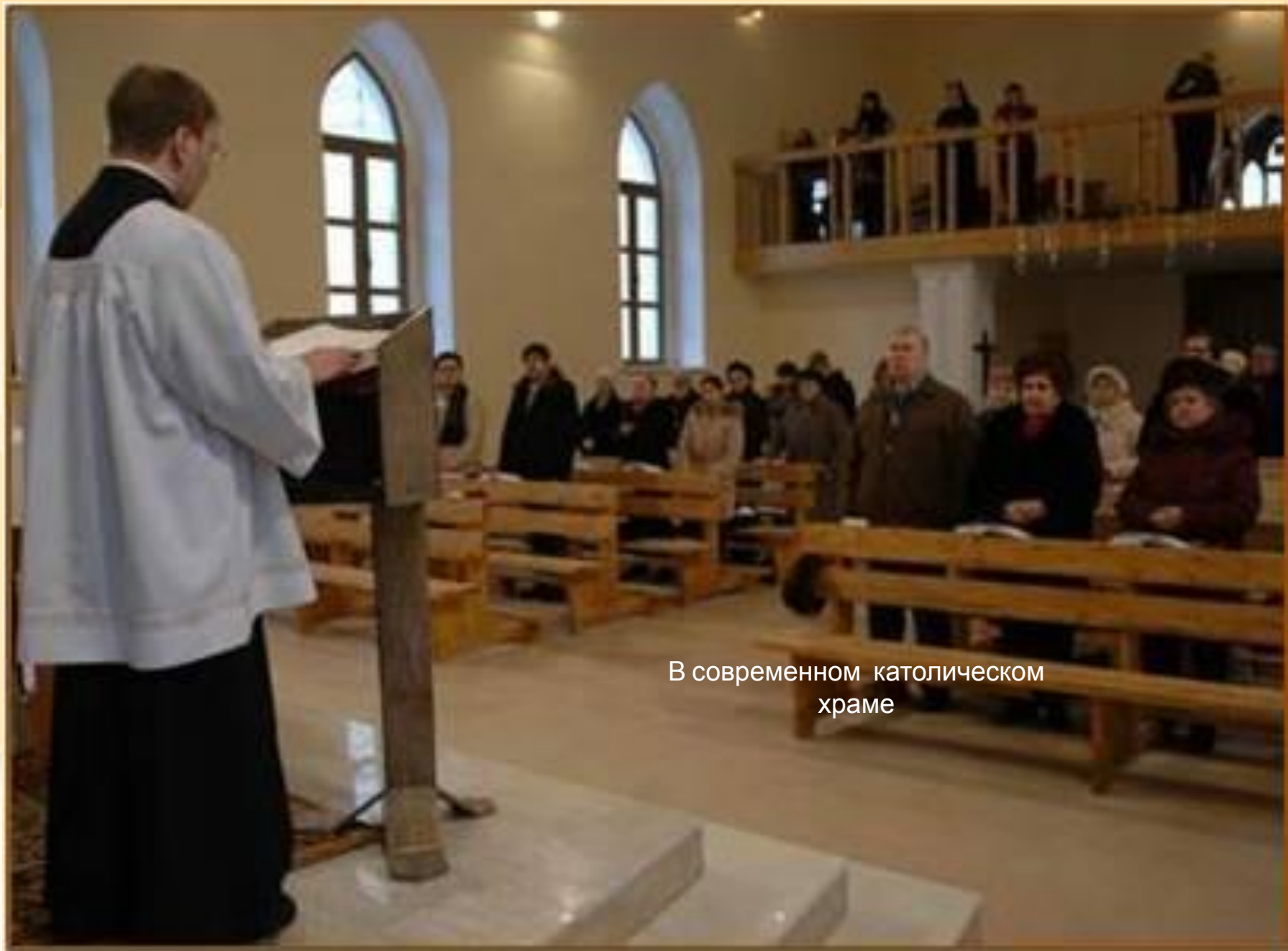
В современном католическом храме