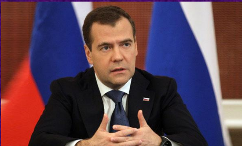
Премьер-министр Дмитрий Медведев

«ФГОС ДО не должно быть повторением школьного стандарта. Надеюсь, это даст системе дошкольного образования прочность, доступность и современность...».