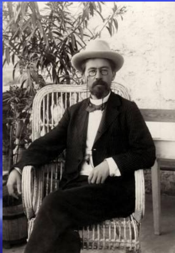
А.П.Чехов, русский писатель, драматург