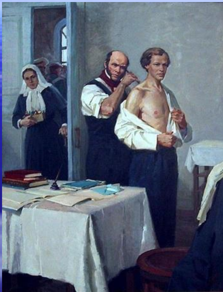
Н.И.Пирогов, врач-хирург, основоположник анестезии (И.Тихий. «Пирогов осматривает Менделеева»)