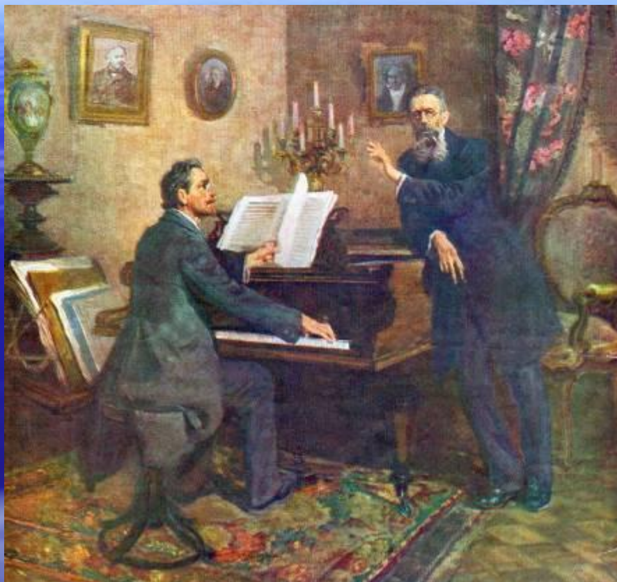
А.А.Спендиаров, армянский композитор и дирижер