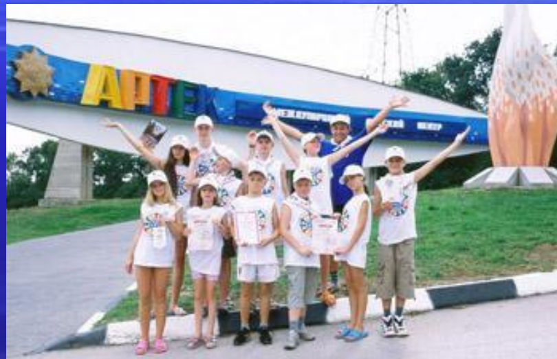
Международный детский центр «АРТЕК»