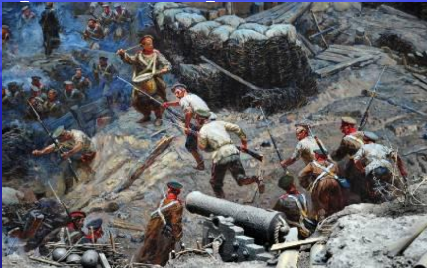
Крымская война. Оборона Севастополя

250 лет мы жили вместе с Россией общей судьбою. Наша земля помнит великие и трагические события. Русско-Турецкие войны, Революцию, Гражданскую войну, Великую Отечественную войну, распад