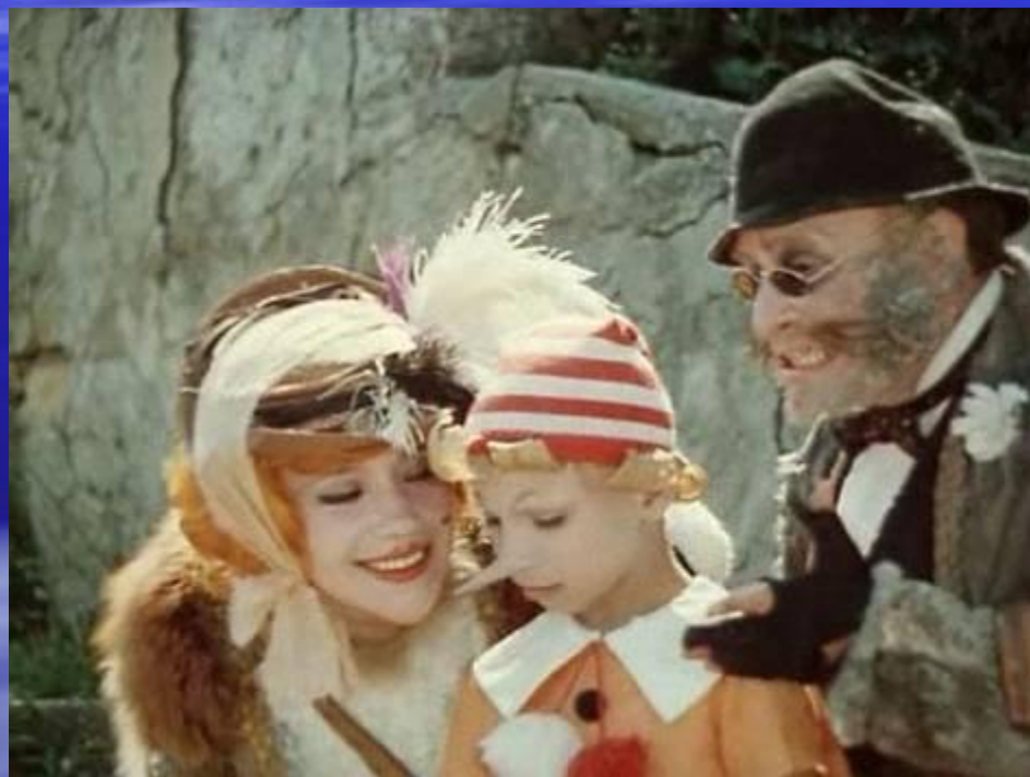
Фильм «Приключения Буратино» Режиссер Л.Нечаев

Снимали любимые фильмы «Приключения Буратино», «Алые паруса», «Остров сокровищ», «Приключения капитана Гранта», «Кавказская пленница», «Человек с бульвара Капуцинов» .