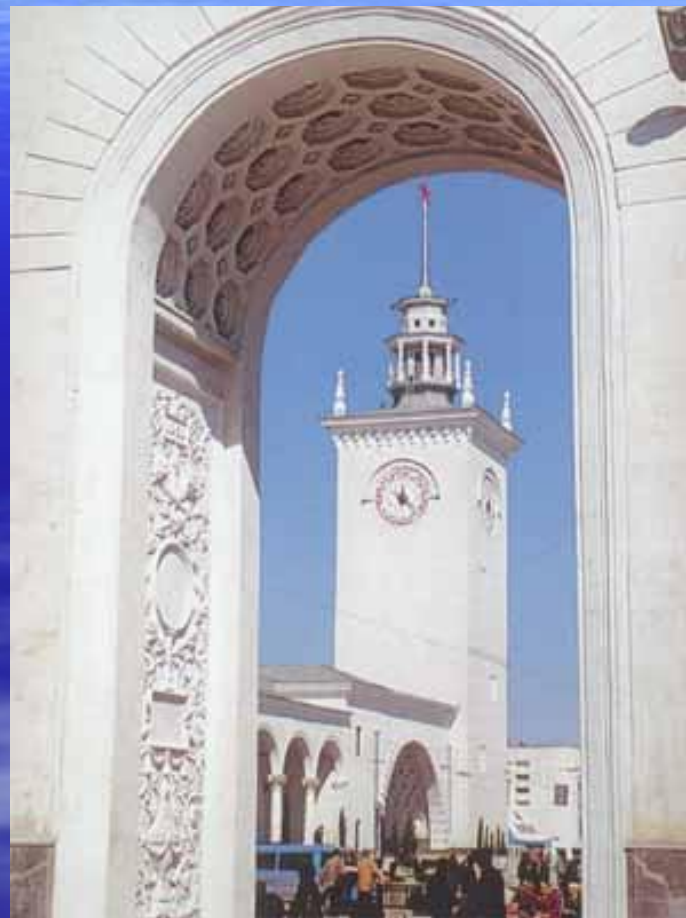
Симферопольский вокзал архитектор А.Н.Душкин