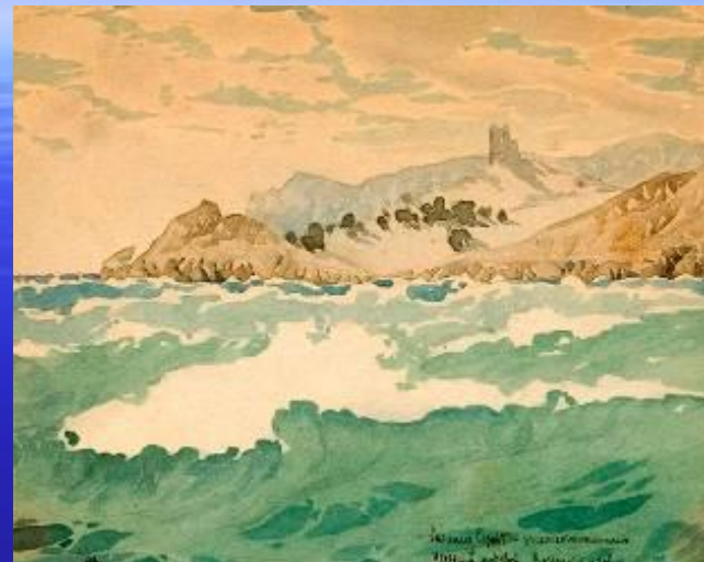
М.Волошин «Коктебель. Затока», 1928