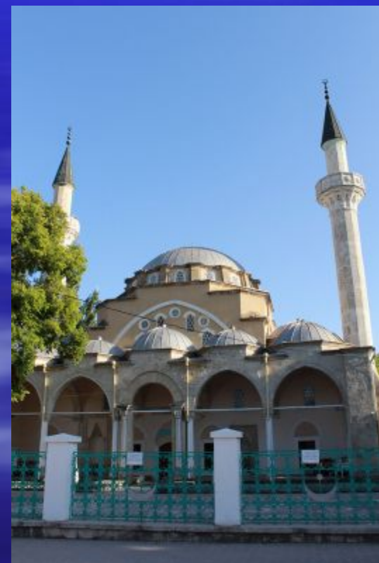
Мечеть Джума-Джами, Евпатория