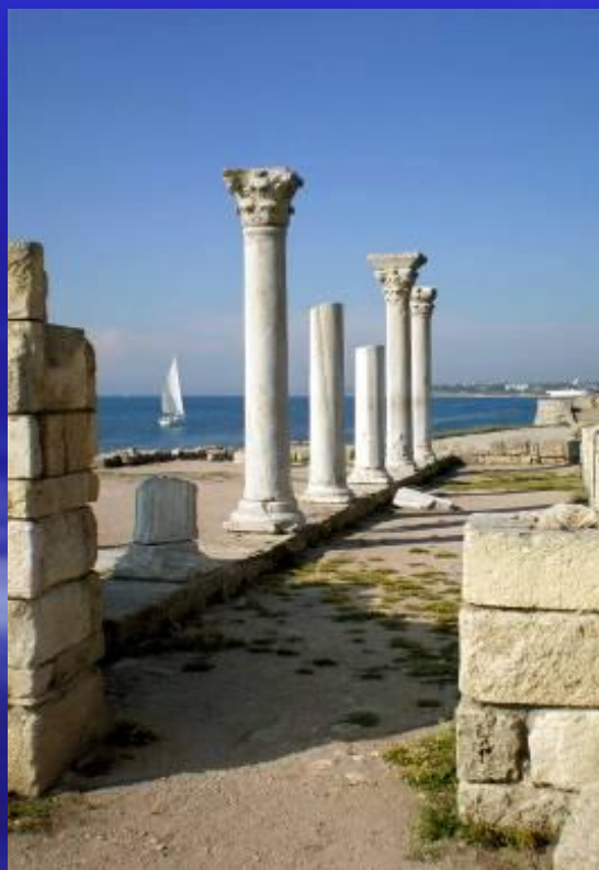
Развалины Херсонеса – древнегреческого города