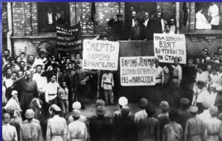
Гражданская война. Взятие Перекопа