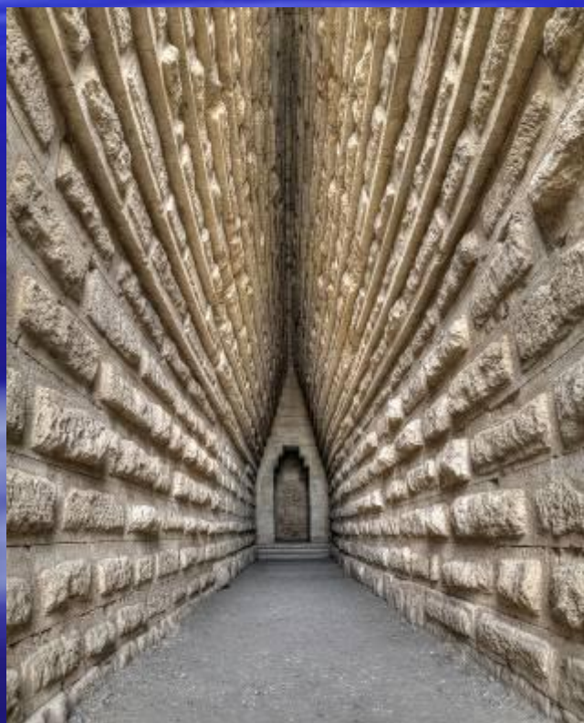
Царский курган – гробница Боспорского царя

На его благодатной земле издавна селились разные народы и образовывались разные государства. Крым в древности был частью Великого Боспорского царства, потом Византийской империи, потом нескольких кочевых империй, затем Крымского ханства, пока, наконец, не вошел в состав Российской империи.