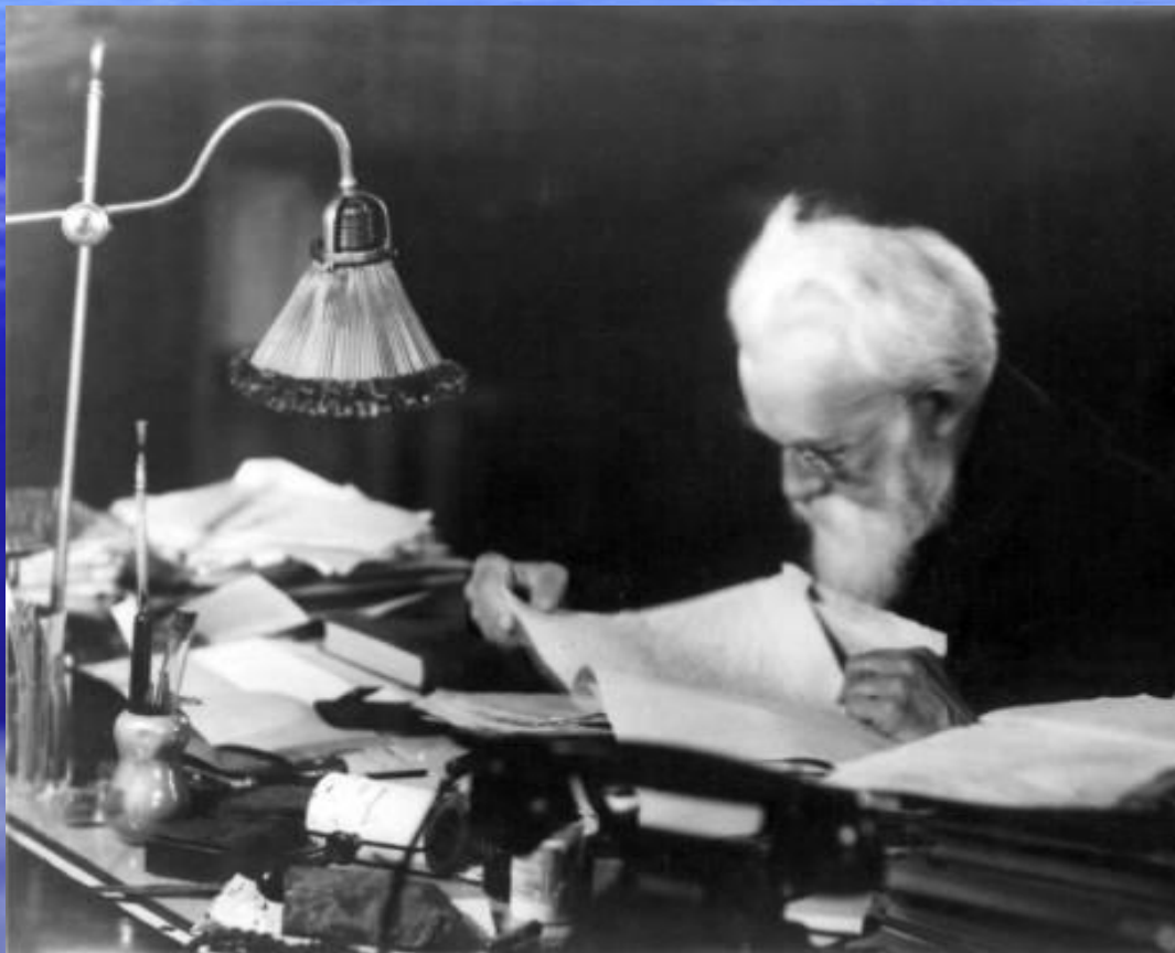
В.И.Вернадский, академик, основоположник учения о биосфере