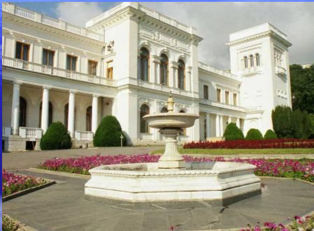
Ливади́йский дворец архитектор Н.П.Краснов