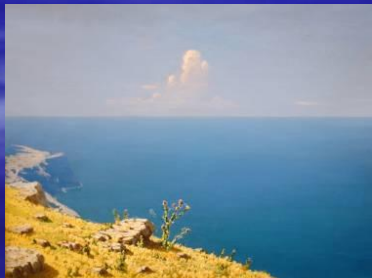
А.И.Куинджи, «Море. Крым», 1898-1908гг.