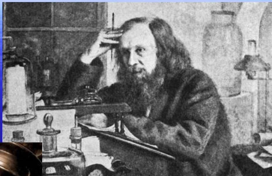
Д.И.Менделеев, великий химик