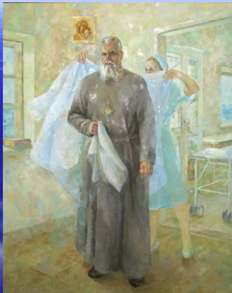
В.Ф.Воино-Ясинецкий (Святитель Лука) хирург, архиепископ (Е.Лис. «Святитель-хирург Лука»)