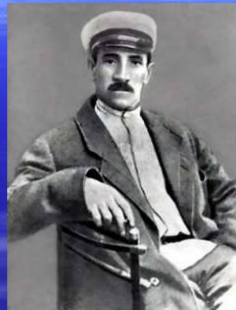
А.С.Грин, русский писатель- романтик