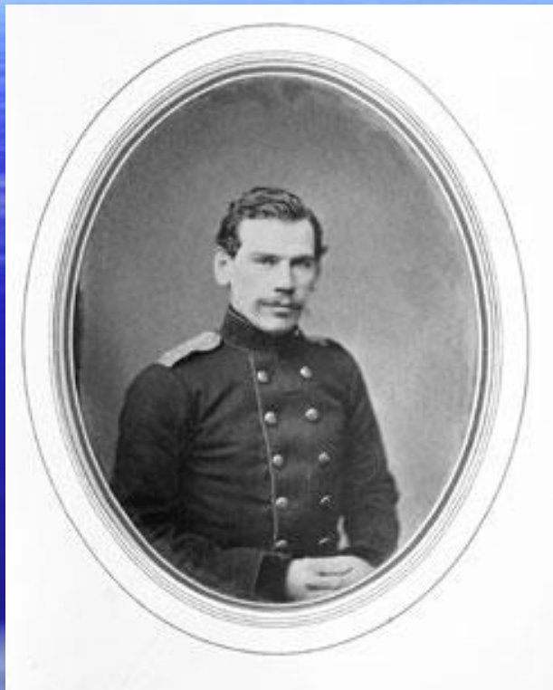
Л.Н.Толстой русский писатель