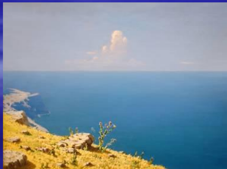
А.И.Куинджи, «Море. Крым», 1898-1908гг.