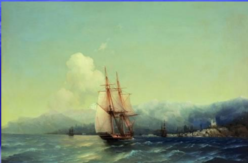
И.К.Айвазовский, «Крым», 1852 г.