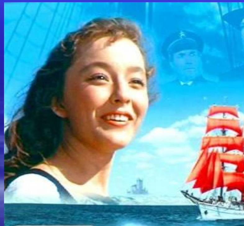
Фильм «Алые паруса» Режиссер А.Птушко