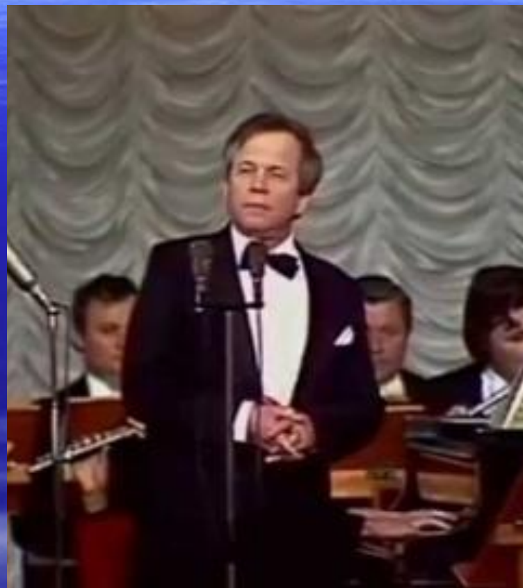
Ю.И.Богатиков, советский певец