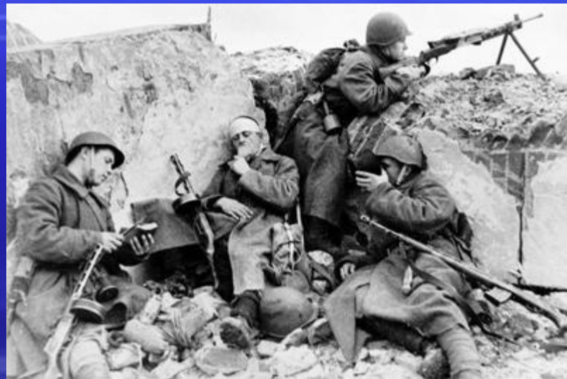
Отечественная война в Крыму