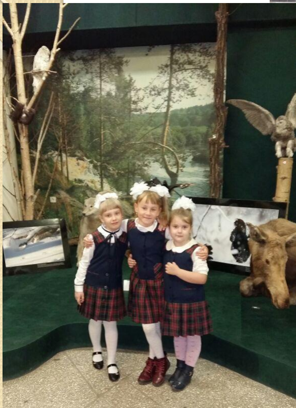
Музей им. Попова