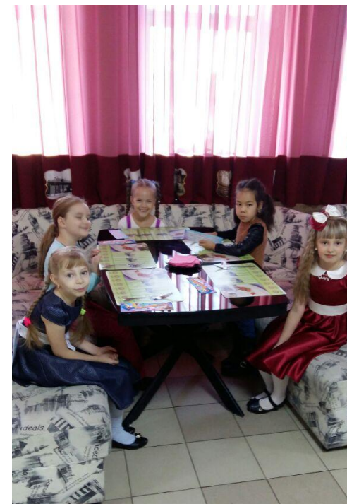
Мы в кафе