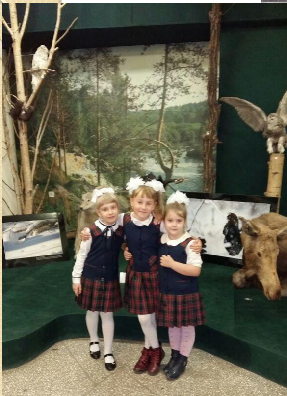
Музей им. Попова