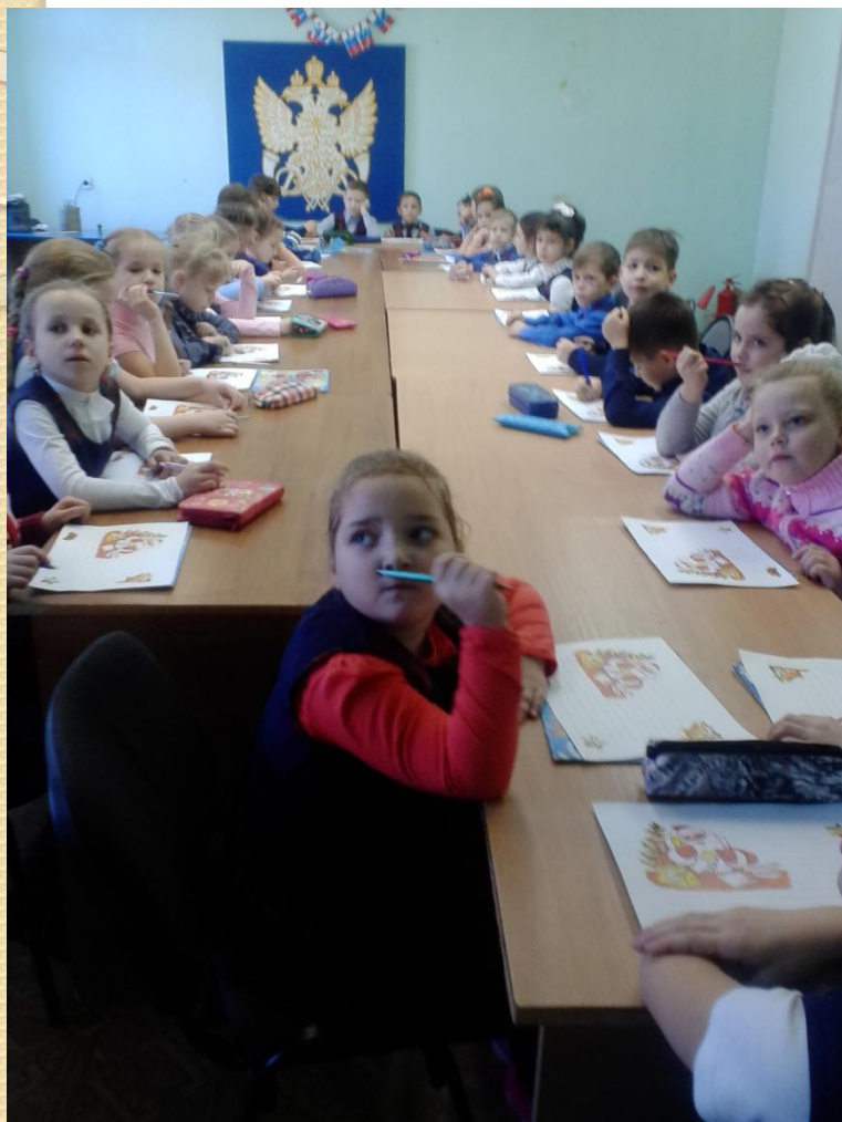
Экскурсия на центральную почту . Сочиняем письмо Деду Морозу.