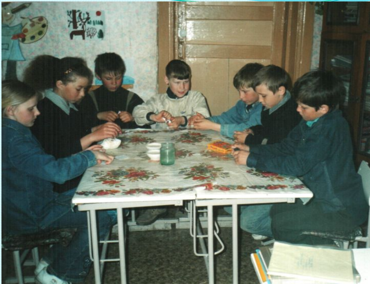
Изготовление кукол по технологии папье-маше