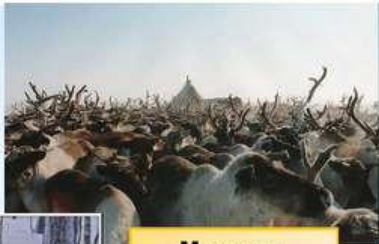
Молоко, масло, мясо

Олень – основа жизни многих народов севера.