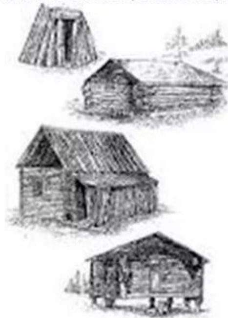
Рис. 8. Типы жилищ хантов и манси ("Восточный край", 1908)