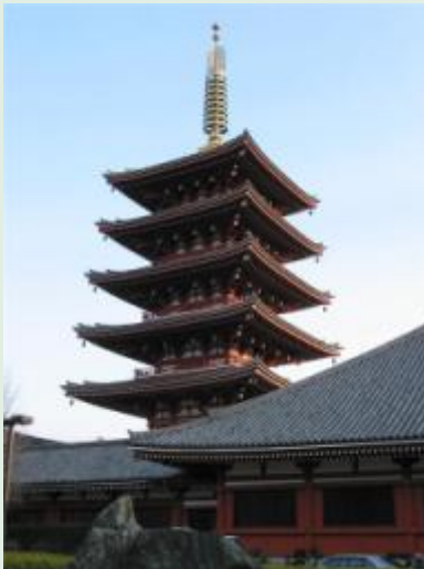
Пагода Храма Синто