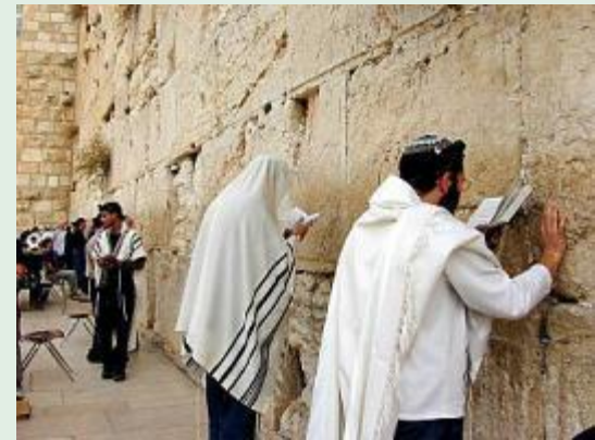
Иерусалим. Стена плача