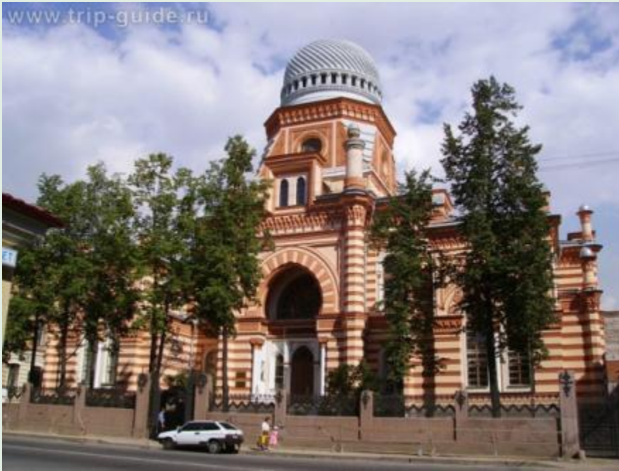
Синагога в Санкт-Петербурге