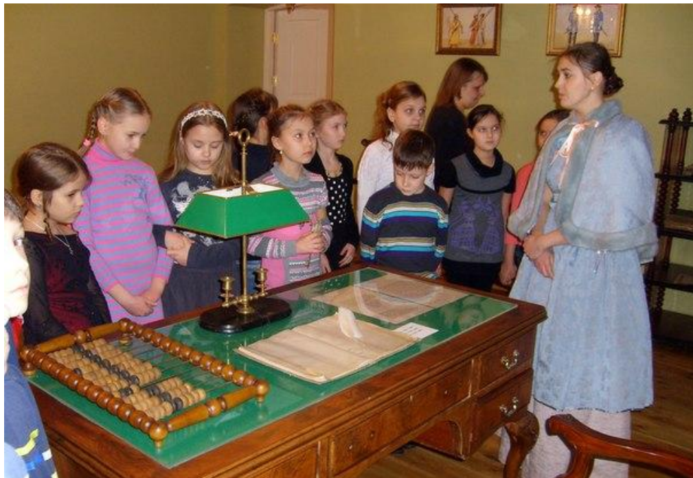
Групповой туризм российских граждан по целям путешествий

КУЛЬТУРНО-ПРОСВЕТИТЕЛЬНЫЙ ТУРИЗМ - это путешествие с целью ознакомления с историко-культурными, археологическими достопримечательностями, посещениями музеев, театров.