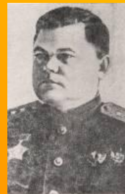
Н.Ф. Ватутин, командующий Воронежским фронтом