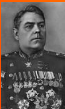
Василевский А.М., представитель Ставки