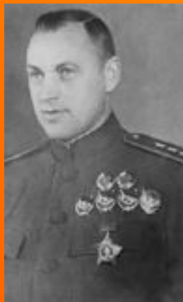
Рокоссовский К.К., командующий Центральным фронтом