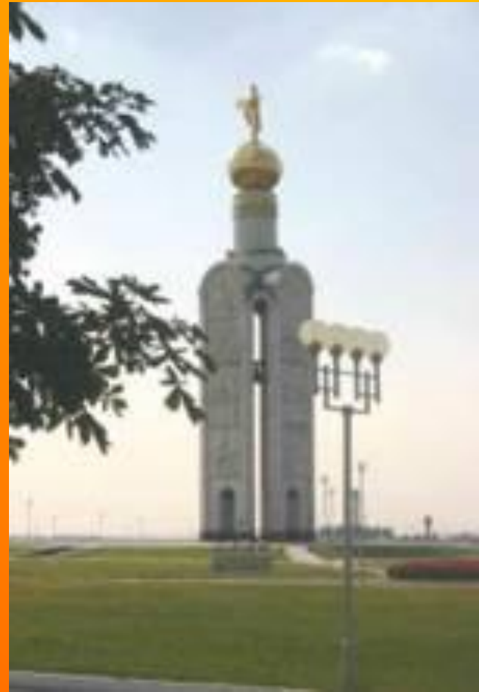
Памятник сражению под Прохоровкой

«Всё дальше от нас Грозные военные годы, Сегодня они- В обелисках и в звонких строках. На все времена Героический подвиг народа Останется жить В благородных и честных сердцах.» (Т. Дунаевская)