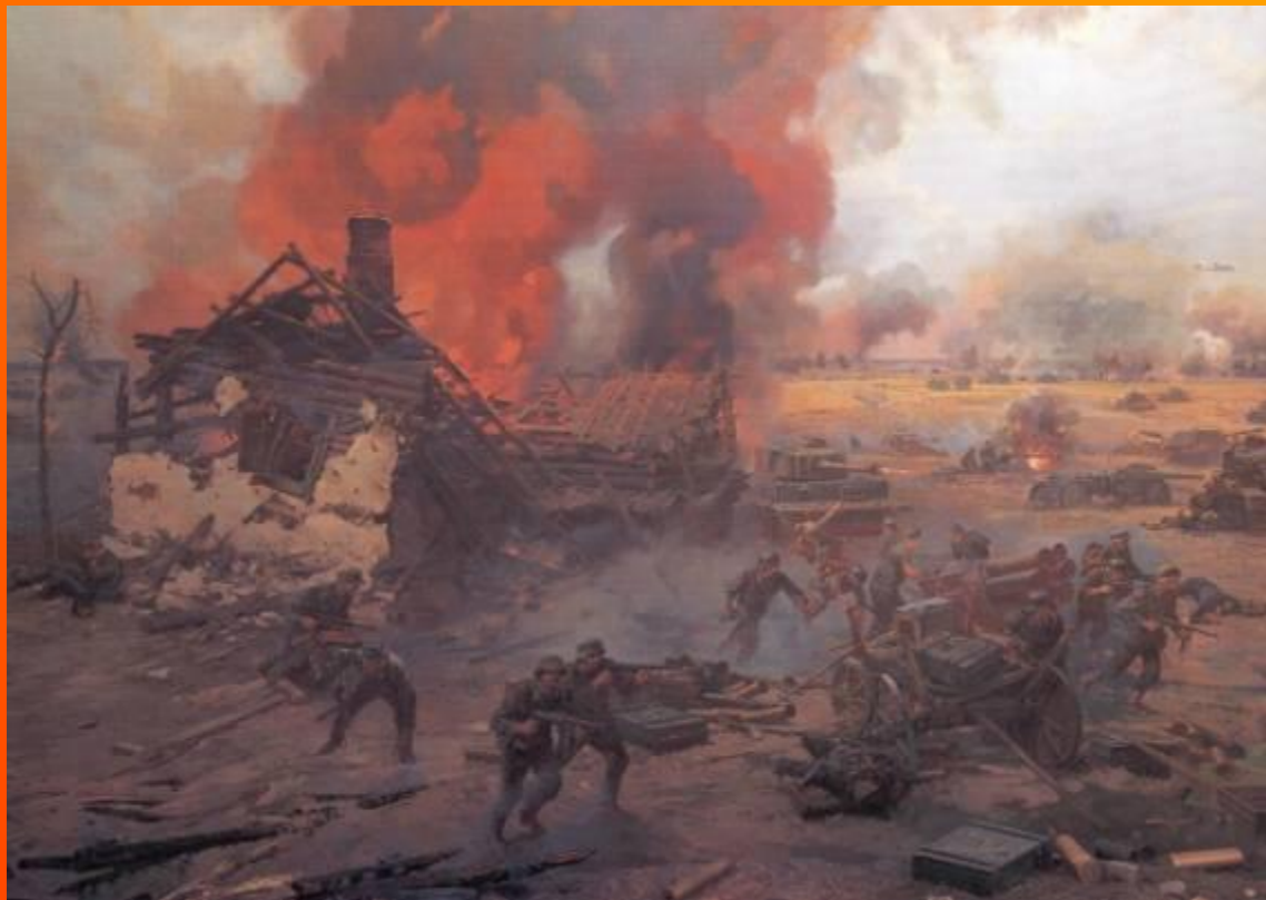
Курская битва (фрагмент диорамы). Присекин Н.С. 1995 г.

« В привычных сумерках суровых Полночным залпам торжества, Рукоплеща победе новой, Внимала древняя Москва. И голос праздничных орудий В сердцах взолнованных людей Был отголоском грозных буден, Был громом ваших батарей. И каждый дом и переулок, И каждым камнем вся Москва Распознавала в этих гулах- ОРЕЛ и БЕЛГОРОД- слова.» (А. Твардовский)