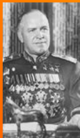
Жуков Г.К. представитель Ставки