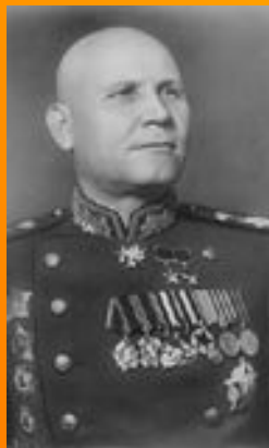
Конев И. С., командующий Степным фронтом