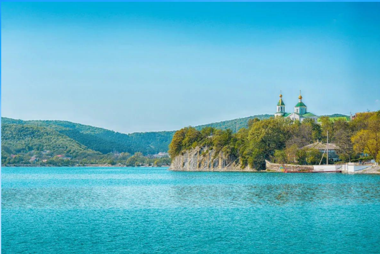
Абрау- остаточное озеро вблизи Новороссийска